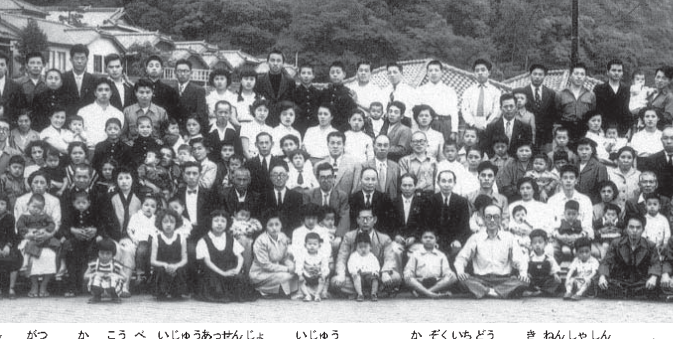
1954年5月20日、神戸移住館で移住する30家族一同が記念写真(『グワボレ移民50年史』、トレーゼ・デ・セテンプロ文化協会、2003年)

「今週末の催し」 8日(土曜日) アメリカ記念公園(Av. Aurora Soares de Moura Pandia Calogeras, 54, Andrade, Barra Libertade) ドミンゴコンサート、午前1時、文協(Rua Sao Joaquin, 381) 9日(日曜日) 中国ブロック運動会、午前8時半、ジブティマ市沖繩文化センター(Av. 7 de Setembro, 1670) Santa Luzia, 74, Liberdade) 屋台まつり、午前1時、愛知県人会(Rua Santa Luzia, 74, Liberdade) ボイ・ノ・ロレッタ、午前11時、子どものそと(Rua Prof. Hasegawa, 1198, Itaquera)