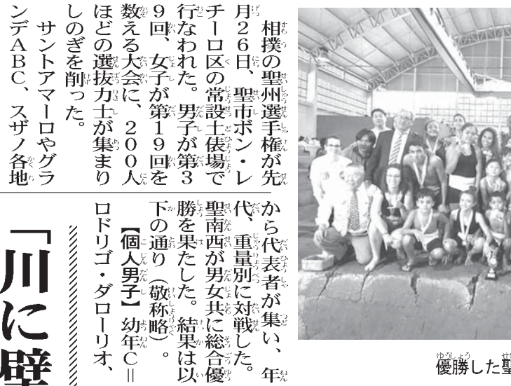
優勝した聖南西チーム

「川に壁は造れない」トランプ氏を笑う不法移民 「川に壁は造れない」トランプ氏を笑う不法移民