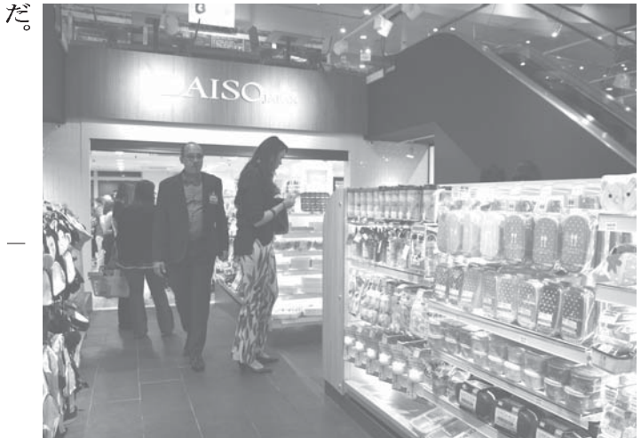
新店舗の内装。人気の弁当箱など、多彩な商品が並ぶ

ダイソー・ブラジルが先月24日、聖市モルンビーに新店舗を開いた。富裕層向けのショッピング・センター「マカハス de Castro, 12000」に開店し、前日23日夜にオープンを祝った。 当地14店舗目で、ヒクタ協力をあつめると2017年、日本では大衆向けという。一等地のショッピング