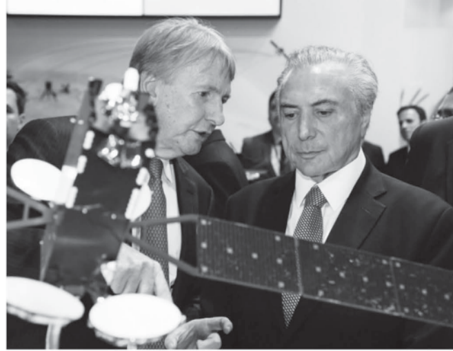
4日のテメル大統領

選挙高等裁判所での14年大統領選挙のジョマ/テメルの選挙違反に関する裁判が大幅に延期されたこと、テメル大統領や原告側の民主社会党(PSDB)がどう見解を抱いているかについて、5日付エスタド紙が報じている。