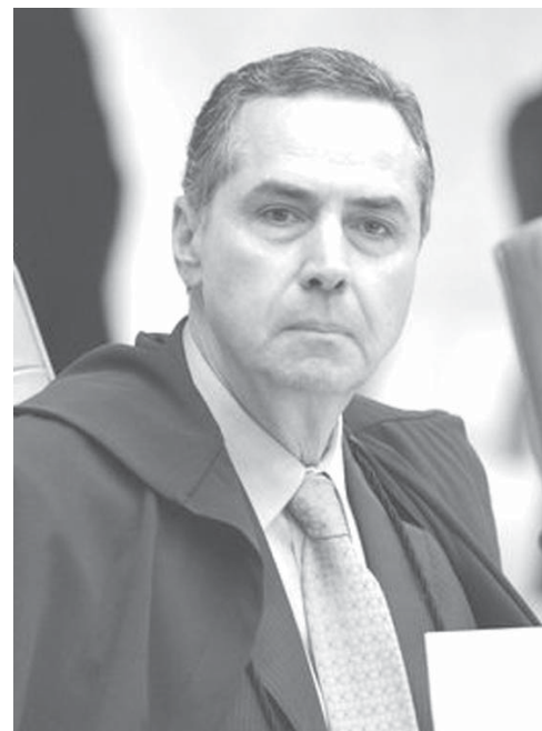
この文章の著者、連邦最高裁判所のルイス・ロペルト・パロゾ判事