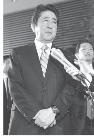
北朝鮮の金正恩首相が、5日午前9時51分、ミサイル発射の様子を見守る。