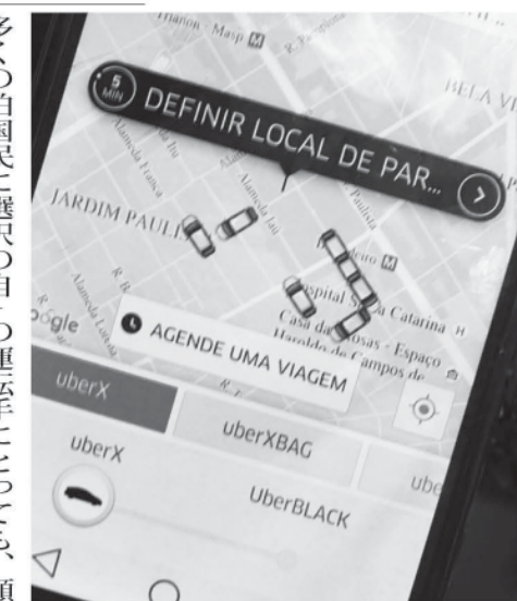
Uberに遂に国の規制が入った。

もう一つの修正案は、Uberや類似サービス会社のドライバーに、営業する市の当局から営業許可を得、許可証を携帯する事を義務付ける。政府与党は所属議員に「修正案に反対せよ」との支持を出していたが、これに従わない議員が続出した。しかしながら、からの議論が継続される。