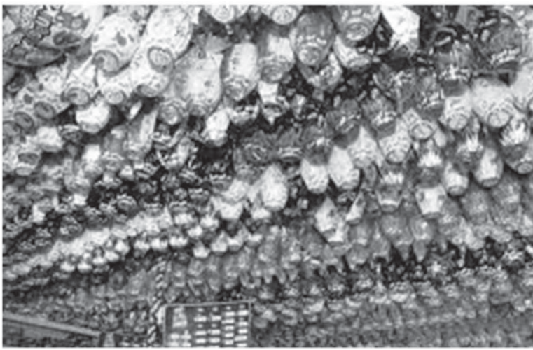
ブラジルのスーパーでのイースターのチョコ販売風景