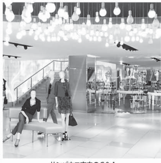
サンパウロ市内のC&A

衣料分野では、2017年の年明けから生産と販売に好転の兆しが見えるものの、消費者側では消費行動が変化しており、不況前の状態には戻っていないと産業マー