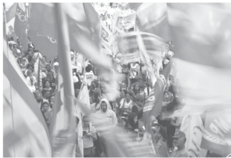
5月1日聖市でのメーデーの行進

労働者の日(メーデー)の5月1日、伯国各地で、労組が労働者の権利保護を求めるデモを行ったと2日付伯文紙が報じた。