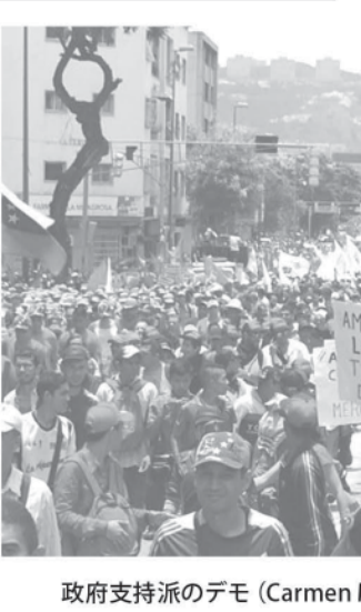
政府支持派のデモ

4月30日に行われたサッカー選手権決勝ベルギー対フランスの試合は、「聖州第4勢力」(伝統の四強の中以一番強い)とマスコミに揶揄されてきたコリンチャンスが、サントス、