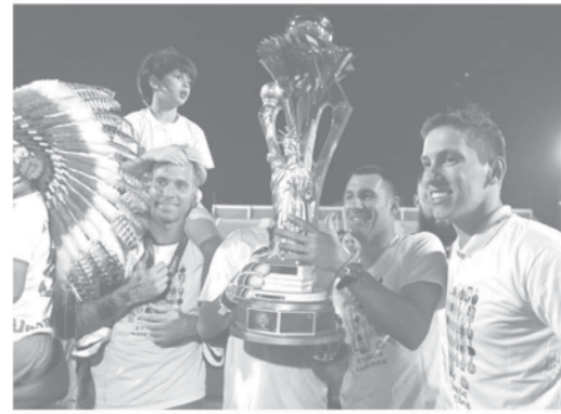
飛行機事故後初の主要タイトル獲得となったシャペコエンセ

経済防衛行政審議会(Cade)が8日、ハイネケン社によるブラジル・キリン社買収を正式に承認した事を公表したと9日付付字紙が報じた。 キリンホールディングスがブラジルのビール、飲料事業をオランダに本社があるハイネケンに売却する話は、2月13日に発表されたが、今回は晴れてCadeの承認を得る事が出来た。この決定は、8日にSG 566/2017として伯国内でのハイネケン