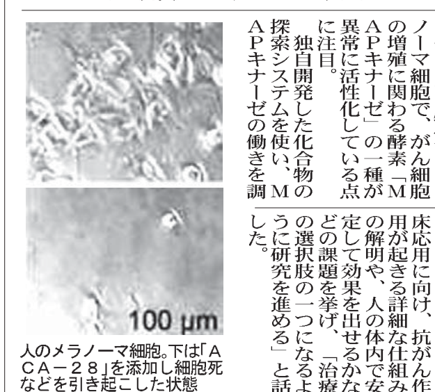
人のメラノーマ細胞。下は「ACA-28」を添加し細胞死などを引き起こした状態