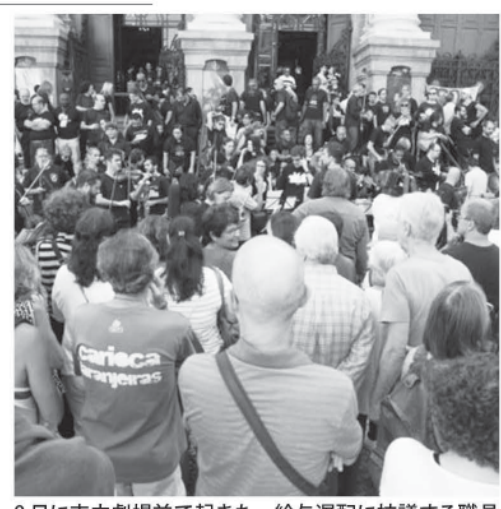
9日に市立劇場前で起きた、給与遅延に抗議する職員や芸術家達のデモ

また、10日付2面のトップ記事で「ジャノッ検査局長官、ジウマル・メンデス最高裁判所の妻が被告を最高裁判所の妻と見せかけた模倣品を針転換したと報じた。ボト語の読める読者諸氏には誤報ととられてしまった。かもしれないが、現実には、こうした前言撤回があつた事をご理解の上、ご容赦いただきたい。」