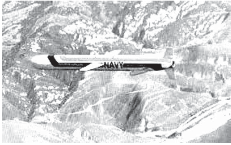
政府が導入を検討している米国製巡航ミサイル「トマホーク」

【共同】政府は北朝鮮による相次ぐ弾道ミサイル発射や核開発継続を受け、日米同盟の対処能力を強化するため、巡航ミサイルの将来的な導入に向けた本格検討に入った。北朝鮮の脅威は新たな段階になったとして、発射地点を巡航ミサイルなどにより破壊する「敵基地攻撃能力」の保有を目指す。早ければ、来年度予算案に調査費などを計上したい意向だ。政府関係者が5日、明らかにした。