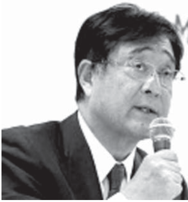
決算発表する三菱自動車の益子修社長

【共同】三菱自動車は9日発表した2017年3月期の連結純損益は、昨年4月に公表した燃費データ不正問題の関連損失を処理し、前期の725億円の赤字から1985億円の赤字に転落した。売上高は前期比15.9%減の1兆9066億円だった。不正によるブランドイメージの低下で国内販売が22%減と落ち込み収益を圧迫し、ウルグアイ国境アセガまで続く。ちなみに東京からタイのバンコクまで4620キロあるが、この地域は発展した。バウマス周辺を通過したのは、ようやく1982年なんだ。それからだよ、この地域が見直されるようになったのは「国家の背骨」といえる。