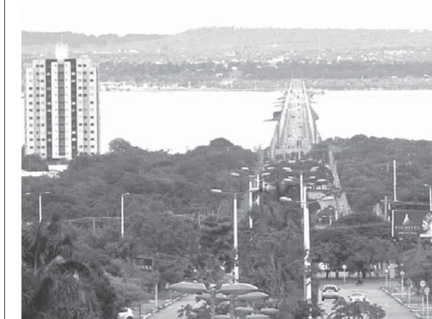
5キロもあるフェルナンド・エンリッキ・カルドーソ橋

「共同」三菱自動車は9日発表した2017年3月期の連結純損益は、昨年4月に公表した燃費データ不正問題の関連損失を処理し、前期の725億円の赤字から1985億円の赤字に転落した。売上高は前期比15.9%減の1兆9066億円だった。不正によるブランドイメージの低下で国内販売が22%減と落ち込み収益を圧迫し、ウルグアイ国境アセガまで続く。ちなみに東京からタイのバンコクまで4620キロあるが、この地域は発展した。バウマス周辺を通過したのは、ようやく1982年なんだ。それからだよ、この地域が見直されるようになったのは「国家の背骨」といえる。