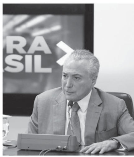
ミシエル・テメル大統領