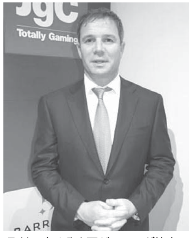
取材に応じる米国ゲーミング協会のジェフ・フリーマン最高経営責任者

【共同】米国のカジノ関連企業が入る団体、米国ゲーミング協会のジェフ・フリーマン最高経営責任者(42)は15日までに、日本のカジノ解禁をにらみ、カジノを中心とする統合型リゾート施設(IR)の開発を目指して「米などの運営会社と日本企業の間で、提携に向けた前向きな交渉が多く進んでいる」と聞いていると明らかにした。