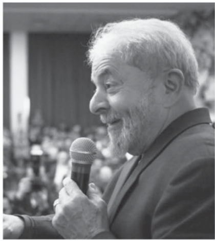
ABCの金属労組のイベントに出席中のルーラ元大統領

【優遇措置は10年3月末日で失効となるはずだったが、09年に税優遇措置延長のために準備されたMP471号は、13年にも延長されており、その恩恵は15年12月末日まで及んだ。北部や北東部、中西部の自動車製造会社はMP471号で年13億レアルの恩恵を被り、ロビイスト達に3600万レアルの賄賂を払ったとされている。一連の金の動きは、財務省傘下の税務監理審議会(CARF)内部で行われていた贈収賄工作に連関し、連警が2015年3月に始めた「ゼロテス作戦」の中で明らかにされてきた。