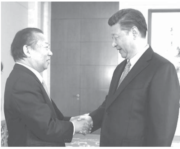
中国の習近平国家主席(右)と握手する自民党の二階幹事長

【北京共同】自民党の二階俊博幹事長は16日、中国の習近平国家主席と北京で会談した。習氏は「歴史をかかみ、未来に向かう精神に基づき、両国が歩み寄り、関係を正しい方向に発展させたい」と述べ、日中関係改善に意欲を示した。二階氏は北朝鮮情勢を巡り、中国の役割を重要だとし、日中の連携を求めた。安倍晋三首相の親書を手渡し、習氏を含めた中国要人の訪日を要請した。