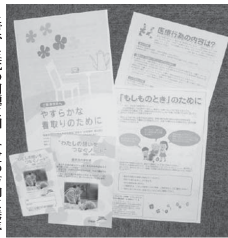
終末期医療に関する各自治体の住民向け啓発パンフレット

【共同】超高齢化で「多死社会」を迎えつつある中、終末期医療について話し合ったり意思表明したりする機会を持つてもらおうと、厚生労働省は延命治療の種類や療養場所などの情報を盛り込んだ市民向け啓発パンフレットのひな型を作成する。国が終末期医療に関する啓発資料を作るのは初めて。早ければ今夏に有識者検討会を立ち上げ、内容を議論する。来年春に完成させ、全国の自治体に提供。地域の事情に合わせて情報を加えるなどして、住民に配布してもらうと見られる。