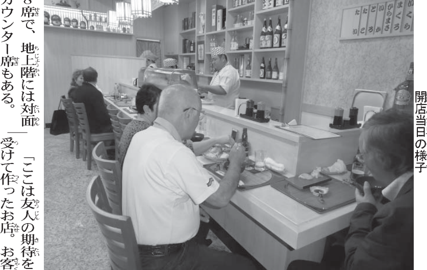
東洋街に久々の寿司店開店

「謙造鮨」が、日本式寿司店として、日本で食べられる寿司と同品質のものをご提供できる店は少ないものか。そんな友人からの要望を受けた店主の思いが、ついに形となった同店は、こだわり