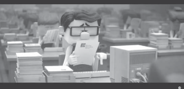
映画の一場面

ジー大学の製品デザイン科に入学し、さらにマウリシオ・デ・ソウザのアニメスタジオでアシスタントとして3年働いた。大学卒業後すぐに「世界のアニメが知りたい」と米国のカリフォルニア州サンディエゴ市の語学学校に留学した。同地の豊かなアニメ文化に触れ、ウォルト・ディズニー・アニメーション・スタジオで働くことを志すようになった。そしてアニメーションを「から学ぶため、カリフォルニア芸術大学(CalArts)