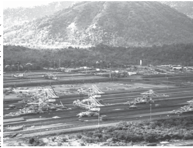
パラ州カラジャスの鉄鉱石採掘現場

(LME)では、3カ月の銅の先物相場が1・8%値下がりし、トン当たり5486ドルを付けた。1月に記録した最低価格、5462・50ドルに迫る勢い。アルミニウムも同様に1・3%値下がりして1879ドル、ニッケルはほぼ横ばいで9145ドルだった。