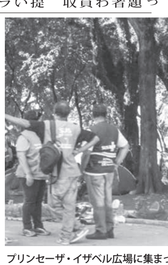
プリンセザ・イザベル広場に集まった常用者とそれを見守る市の職員

【既報関連】聖市ルズ区クラコランジアで21日に行われた麻薬密売者と常用者の一掃作戦後、900人が一斉に現場に踏み込み、保健衛生部門や社会福祉部門の対応が、近隣23カ所でミニクラコランジアを形成している。26日付フォーリャ紙が報じた。