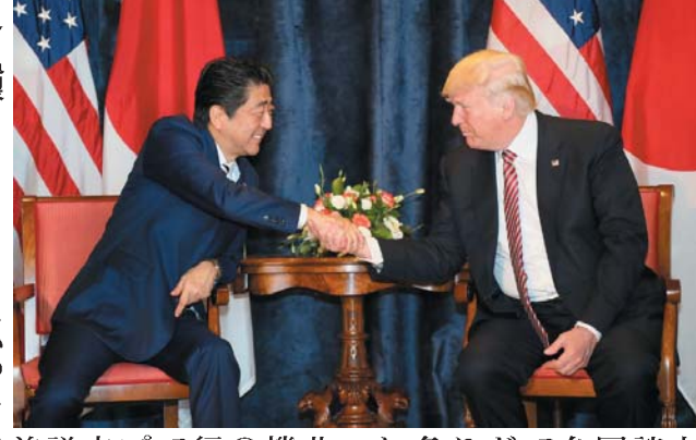
会談を前に握手する安倍首相(左)とトランプ米大統領(右)。26日、イタリア南部シチリア島タオリンで開かれたG7首脳会議の開幕式で撮影された。

【タオリン共同】トランプ米大統領の初参加となった先進7カ国(G7)首脳会議(サミット)が26日、イタリア南部タオリンで開幕した。中東から始まった外遊で世界を「善と悪」に二分し、あらゆる問題を「米国第一」で「取引」しようとするトランプ氏、人権や民主主義を旗印にしてきた米国の姿はかすみ、国際協調は大きく揺らぐ。主要議題は調整済みが常のサミットだが、今回はシナリオなき異例の展開だ。