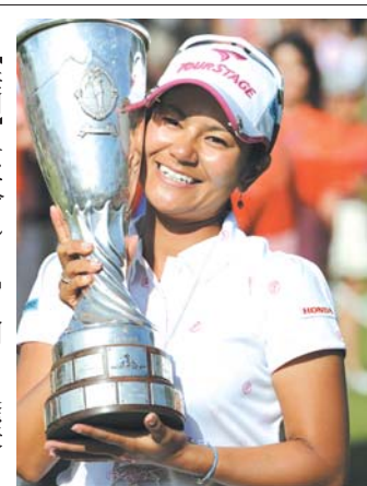
2009年7月、米女子ゴルフのエピアン・マスターズツアー初優勝を飾り、優勝カップを手に笑顔の宮里藍

【共同】女子ゴルフの元世界ランキング1位で、藍ちゃん(宮里藍)の愛称で人気を博す宮里藍(31)が26日、今季限りの現役を退く意向を表明した。29日に記者会見を