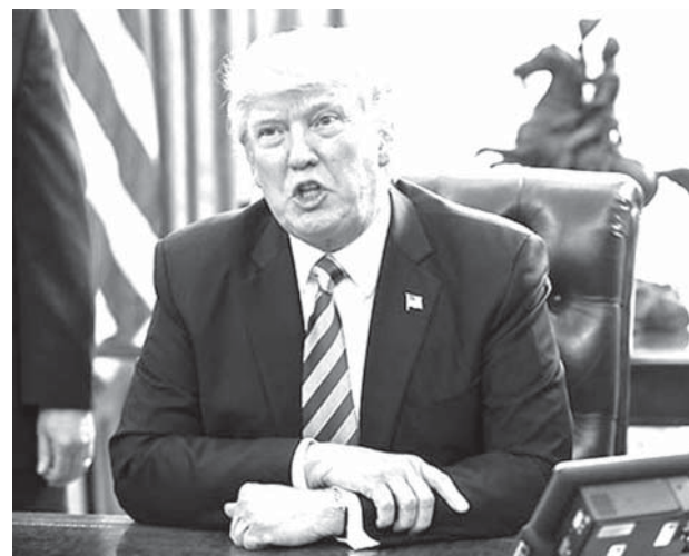
法廷で苦しい闘いが続いているトランプ大統領