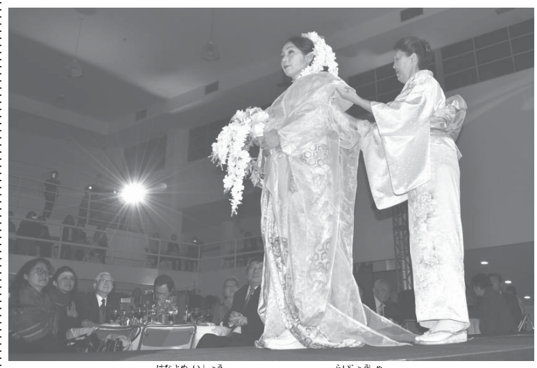
花嫁衣裳にうっとりする来場者