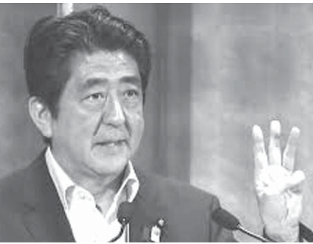
認可保育所などに入れられない待機児童を2020年度末までに解消すると表明した安倍晋三首相

「共同」安部晋三首相は31日、認可保育所などに入れられない待機児童を2020年度末までに解消すると表明した。