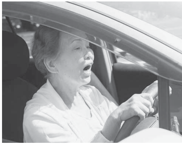
「操作がごちなくなってきた」高齢者ドライバー

【共同】高齢になると、視力や運動能力、認知機能などが低下する傾向にある。だが、車がないと生活に困るので、運転をやめられないこともある。高齢者が安全に運転を続けるには、どうすればいいだろうか。