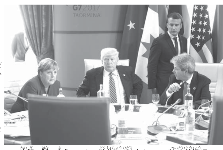
G7会議で話し合うメルケル独首相(左)とトランプ米大統領

The Old German Problem, by VICTOR DAVIS HANSON, http://www.nationalreview.com/article/448150/germany-negative-attitude-toward-united-states-not-new