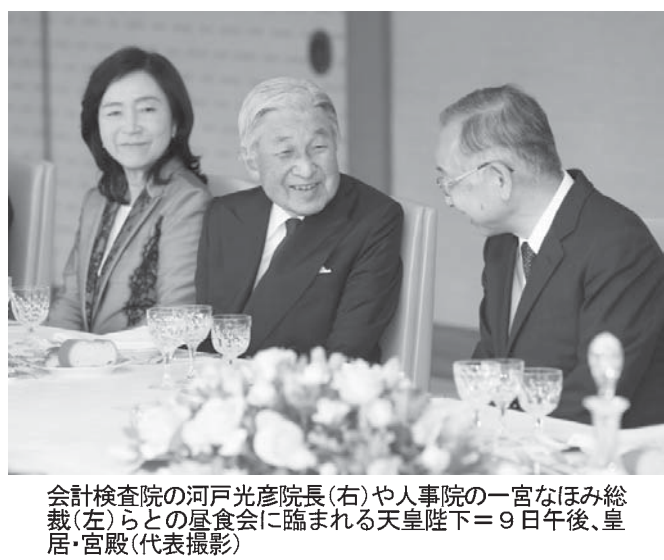
総一宮の院人事や(右)院長光彦の河戸の査院との会食に臨まれる陛下=9日午後、皇居・宮殿

【共同】天皇陛下の退位を実現する特例法が成立し、今後は約200年ぶりの退位に向けた準備が本格化する。宮内庁幹部は「陛下が今のスタイルを続けるには年齢的に限界が近づいたと胸をなで下ろすのが、象徴天皇制を支える国民の敬意や愛着が新天皇と上皇に分散する「代替わりの副作用」(側近)を懸念する声も。宮内庁は難しいかじ取りを迫られそう。