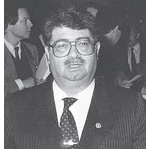
首相時代のトルグット・オザル氏

8. 「ハイレティム(全てアレンジした)。 心配するな。」 オザル首相は「心配するな」と言ってくれたが、その後トルコ政府からも、トルコ航空からも連絡が来ない。森永さんは心配になってきた。このままではサダム・フセイン声明の設定した期限が過ぎてしまう。