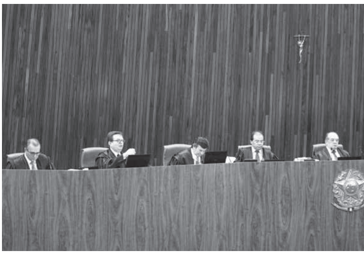
9日のTSEの様子

各判事の投票は、報告官の投票後、1人持ち時間20分ずつで行われることになっており、午前中か午後の早い時間帯に結審と見られていたが、報告官のエルマン・ベンジャミン判事は報告書を読み上げ、自分の票を投じるまでに9日だけで4時間を費やした。