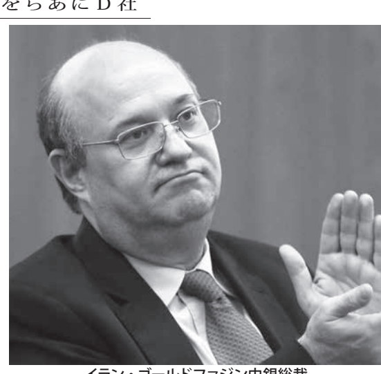
イラン・ゴールドファジン中銀総裁

市 クラコランジアで女性が倍増 7人に1人が妊娠まで 聖市セントロのクラコランジアで生活する麻薬常用者の中で、女性の比率が1年で2倍以上に増えていることが明らかにされた。クラコランジアでは、女性は38.6%、男性は18.7%しか避妊対策を採っていない。さらに、女性常用者の44.1%は幼少時に肉体的または性的にも虐待された経験があり、70.6%はクラコランジアで肉体的または性的な暴力被害に遭っている。