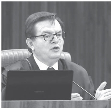
TSEで「シャッパ無効」を訴えたベンジャミン判事

「私に裁判官として、連邦選挙裁判所の長官は、最高裁判所判事も兼ねていない。葬儀に参列するくらいは良いが、そんな権柄は俺は担がないぞ」と訴えました。