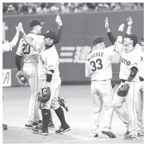
連敗を13で止め、タッチを交わし喜ぶ巨人ナイン