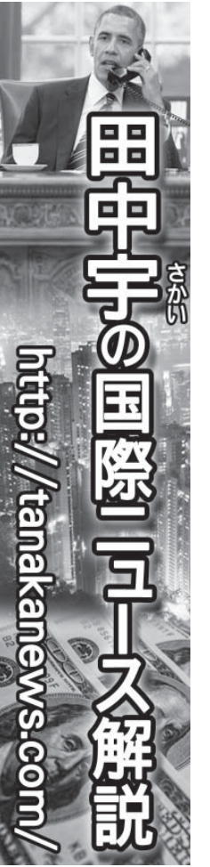
田中重之の国際ニュース解説