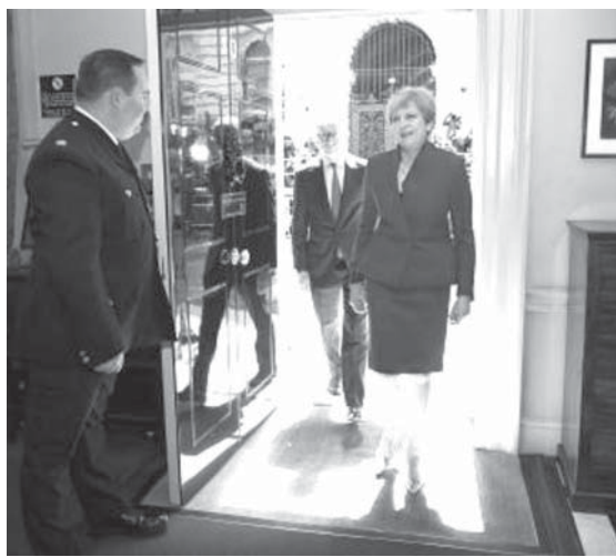
英首相官邸に入るメイ氏(中央右)

【ロンドン共同】英国のメイ首相は9日、総選挙を受けた閣僚人事で、欧州連合（EU）離脱交渉を担うデビッド・ドブソン外相と主要閣僚の留任を決めた。総選挙ではメイ氏率いる与党保守党が過半数割れとなったが、19日にも始まるEUとの離脱交渉を控えて、政局の安定化を優先させたとみられる。