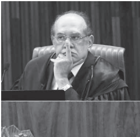
TSEのジウマル・メンデス長官

10日付本紙でも報じたように、報告官のエルマン・ベンジャミン判事(ヒト社からの報奨付供述)は4時間かけてジウマ/テメル・シヤツパの当選無効を主張した。無効を激しく主張した。だが、8日「オデブレヒト」社からの報奨付供述(デラソン・プレミアード)を裁判材料に含めな