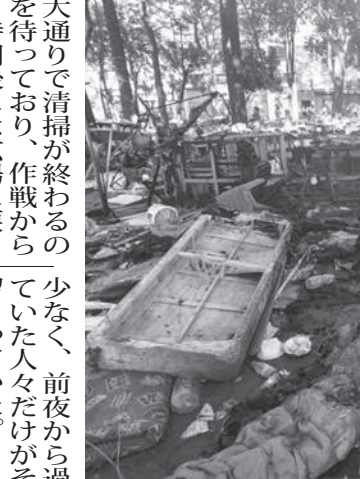
11日のプリンセザ・イザベル広場一掃作戦の様子

【既報関連】聖州政府と聖市は11日、聖市セントロのプリンセザ・イザベル広場(P広場)に密集していた禁止薬物常用者の一掃作戦を行った。12日付の紙が報じた。 聖市は今後、市内のいかなる場所でもテントやバラック小屋を建てるのは禁ずるとしている。この問題に対応する、聖市の「贖罪計画」担当コーディネーターのアル