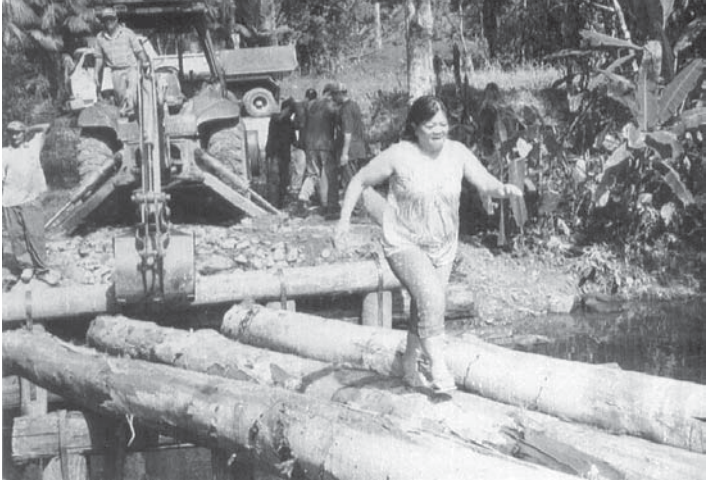
ニウセさん(プロジェクトの1つの工事現場で)

「海興がウソを言つて我々を入れた。騙された。海興のウソが植民地失敗の原因」 「土地が悪く、何を作つても、モノにならなかつた」 「半年くらいで海がひく様に、他所へ移動する