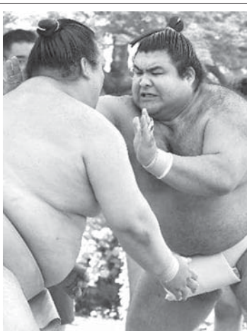
名古屋場所に向けた稽古で、横綱稀勢の里(左)にぶつかる新大関高安

【共同】大相撲の新大関高安が27日、愛知県長久手市の田子浦部屋で名古屋入り後初の稽古を終えた。名古屋場所(7月9日初日、愛知県