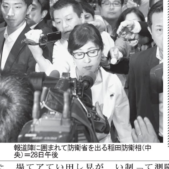
報道陣に囲まれて防衛省を出る稲田防衛相(中央) = 28日午後

遮水壁、全面凍結を了承 【共同】原子力規制委員会は28日、福島第1原発の汚染水対策を説明した。汚染水は地下に浸透し、地下水が汚染水と混ざり、井戸から湧き出る可能性がある。汚染水は地下に浸透し、地下水が汚染水と混ざり、井戸から湧き出る可能性がある。