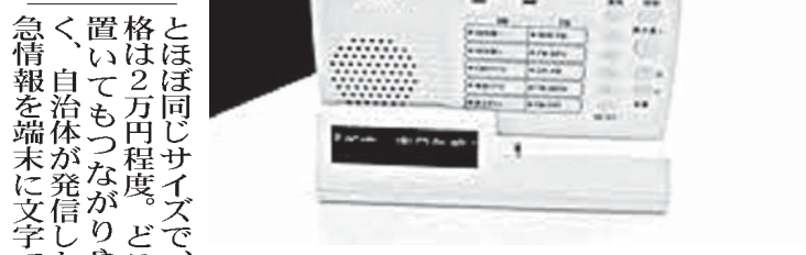
ポケベル電波を使った情報提供システムの専用端末

【共同】「0840（おはよう）」「4649（よろしく）」。1990年代、語呂合わせの数字メッセージが若者の間で大流行したポケベル（ポケベル）。建物内や地下でもつながりやすい特性が見直され、東日本大震災後、防災分野でポケベル電波を使った情報提供システムを導入する自治体が増えている。専用端末に文字や音 【共同】「0840（おはよう）」「4649（よろしく）」。1990年代、語呂合わせの数字メッセージが若者の間で大流行したポケベル（ポケベル）。建物内や地下でもつながりやすい特性が見直され、東日本大震災後、防災分野でポケベル電波を使った情報提供システムを導入する自治体が増えている。専用端末に文字や音