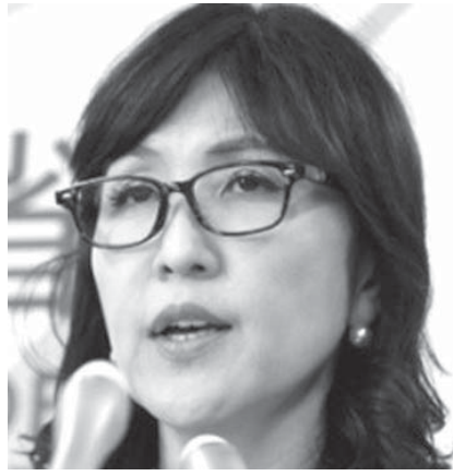
稲田防衛相が自衛隊の政治利用と受け取られかねない発言をした。板橋区で演説した稲田防衛相。

【共同】逆風続きで守勢に回る安倍晋三首相が新たな痛みを被った。将来の首相候補と期待する稲田防衛相が自衛隊の政治利用と受け取られかねない発言をし、政権の「緩み」を改めて露呈する格好となった。失言以降の政権の動きをたどると、誘って来た危機管理にほころびが生じている様子がうかがえる。「秘蔵っ子」をかばい続けられ、さらに批判を招きかねない。東京都議選を前に、政権は揺らぎ始めた。