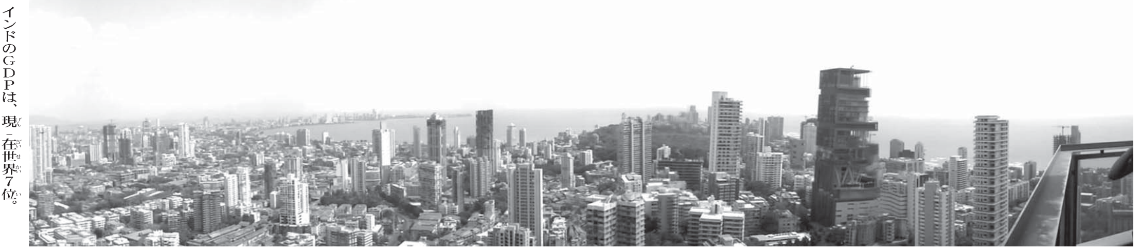
インド都市圏第2位のムンバイは、経済の中心地

なぜインドは、敵対するアメリカ、中国、ロシア、両方と仲よくできるのでしょうか？ まず、お知らせから。トランプさんが、世界的に孤立しています。その「根本的理由」は何でしょうか？ 「ダイヤモンドオンライン」さんに記事を書きました。 「私たち自身も気がつくべき」内容です。是非一読ください。← http://diamond.jp/articles/133334 ●スマホ、携帯で読めない場合は、PCで試してください では、本題。アメリカのトランプ大統領とインドのモディ首相が、初めて会いしました。 二人は、かなり仲良しになったそうです。← 《『新たな「プロモーション」？ 初の米印首脳会談で友好関係を演出』6/27(火) 17:11 配信》 【AFP時事】米国のドナルド・トランプ（Donald Trump）大統領とインドのナレンドラ・モディ（Narendra Modi）首相は26日、米ホワイトハウス（White House）で初の首脳会談を行った。 直後の記者会見では、報道陣の前で何度も抱き合うなど「プロモーション」が強調された。トランプは「密着した握手」を繰り返した。モディは「握手は、何よりも重要なことだ」と述べた。 モディは「インドは、歴史的にもいえるべき」とあり、トランプは「インドとパキスタンが上海協力機構（SCO）に正式加盟（AFP時事）カシミア（Kashmir）地方の領有権をめぐる対立しているインドとパキスタンの安全確保が重要だ」と述べた。 「上海協力機構（SCO）」に正式に加盟した。カザフスタンの首都アスタナ（Astana）で開かれた年次首脳会議で、両国の加盟が承認された。皆「存知」のようだが、中国とロシアが主導する「世界多極化を推進するための組織」で、「アメリカの極端な主張を打ち破るための組織」。 「反米の害」と呼んでいられる「反米の害」にインドは入った。つまり、インドは、中国、ロシアと良好な関係にある。 そして、もつと驚くべきことに、「反米の害」に入っても「アメリカと良好な関係にある」。 なぜ、そんなことが可能なのでしょうか？ ▼世界の「成長センター」インド 皆さんご存知のように、日本、アメリカ、EUは、軒並み「成熟期」。 高度成長時代は、大昔に過ぎ去り、「低成長時代」が近づいている。 「高成長の代名詞」といえば、1990年代以降、中国でした。 しかし、この国も、成長が大幅に鈍化している。 そう、中国は、「成長後期」にある。 中国が今の状況になること、本メルマガの読者さんは、12年前からわかっていました。 05年に出版した「ポロポロになった覇権国家」には、「中国は、08年〜10年の危機を短期間で乗り切った成長をつづける」。 しかし、2010年からは「成長後期」に入るので成長は鈍化していく。成長は、2020年頃までつづくと書いてあった。 今、まさにそういう方向で動いています。 さて、日米欧中経済の未来は、全体的に「明るくない」。 そして、中国にかわって「世界の成長センター」になっているのがインドなのです。