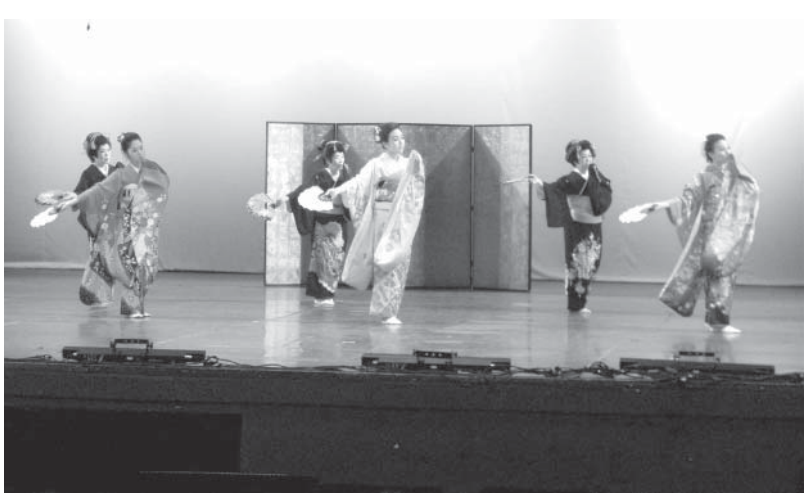
舞の舞でしっとりとした幕開け

パラナ民族交流協会(AINTEPAR)主催の『第56回パラナ民族芸能祭』が、同州クリチバ市で2~3日にグアイラ劇場で開催され、12カ国の移民コミュニティから17団体が参加した。