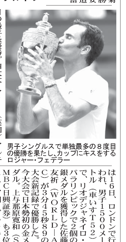
男子シングルスで最多の8度目の優勝を果たし、カップにキスをするロジャー・フェデラー