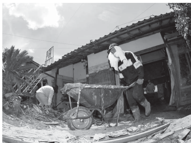
厳しい暑さの中、民家に流れ込んだ土砂を撤去するボランティア=17日午後、福岡県朝倉市(魚眼レンズ使用)