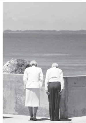
慰霊の訪問で拝礼される天皇、皇后両陛下(4月、パラオ・ペリリウ島)