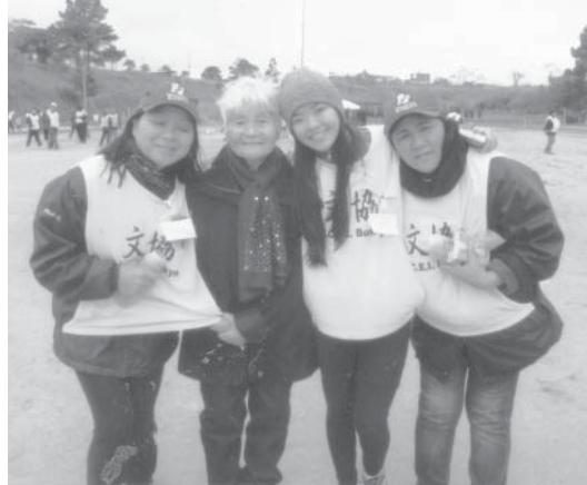
2017年7月2日、イビウーナ文化体育協会主催の家族慰安大運動会にて競技の案内・世話役で活躍する婦人たちが...