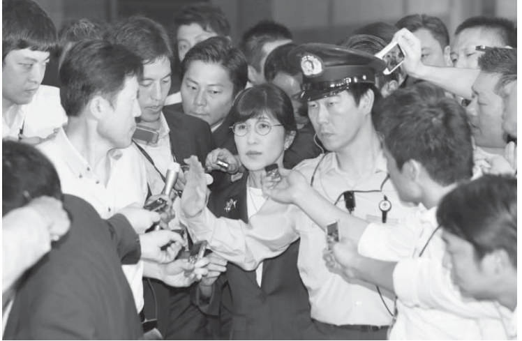
大勢の報道陣に囲まれ、防衛省を退庁する稲田防衛相=27日午後8時8分

【共同】稲田朋美防衛相は安倍晋三首相の「秘蔵っ子」で、首相候補の一人と目されてきた。昨年8月、内閣の目玉人事として起用されたが、南スーダン国連平和維持活動（PKO）日報隠蔽問題の対応に加え、憲法軽視や自衛隊の政治利用とも受け取れる問題発言も繰り返した。政権の足かせとなり続け、27日に防衛省事務方と陸上自衛隊の両トップの引責辞任も固まり、1年足らずで退場せざるを得なくなった。