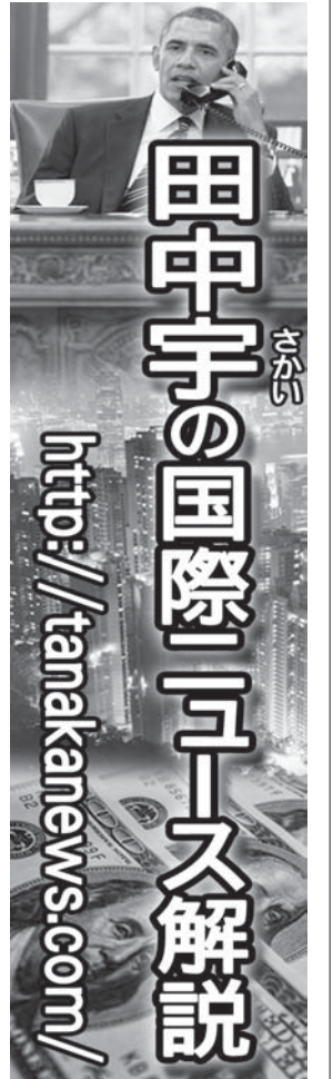
田中宇の国際ニュース解説