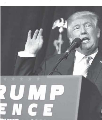
トランプ氏の支持率は36%、大統領として戦後最低を記録した

させた。27日付の党機関紙、労働新聞は1面の社説で、4日のICBM「火星14」発射の成果を強調し、軍事行動を排除してないトランプ政権をけん制した。 日本関係者によると、北西部亀城でミサイル発射のための整地作業や関連車両が確認されたほか、亀城以外にも不審な動きを見せる。米メ