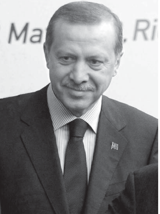
レジェップ・タイイップ・エルドアン大統領