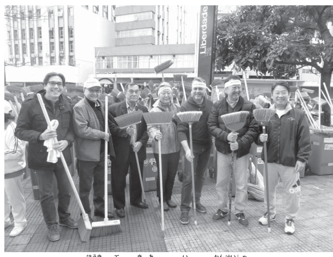
手を手に気合いを入れた関係者

「市民の皆さんが主役。力を合わせて私たちの街をピカピカにしよう」。サンパウロ市のジョアン・ドリア市長の言葉。『パイホー・リンド (Paião Lindo, きれいな街)』を受け、430余人のボランティニアが5日、リベルダーデ広場に集結し、東洋街美化大作戦が開始された。