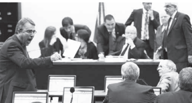
10日の選挙法改正特別委員会

国庫から巨額選挙費用拠出? 10日未明、下院の政治改革特別委員会が、17対15というきわどい票で、大政党内有利な選挙システム変更案(ディストリクツ大選挙区単記相対多数性)を承認したが、下院・上院全体での通過が難しいと見られている。10、11日付伯字紙が報じている。