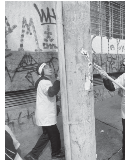
清掃に汗を流す婦人ら

ドリア市政が最初から重点政策として実施する「シダーデ・リンド」街路美化事業の延長として5月2日に打ち出された。32区役所が美化に必要とする用具を準備するが、市民がボランティニアとして参加し、自らの手で居住地区をより