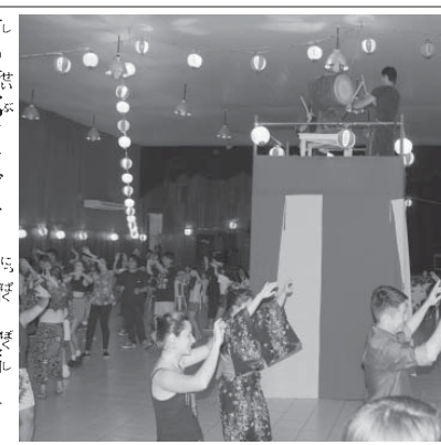
マナウスで盆踊り大会。盆踊り大会は、日本の屋台の夏の風情を、マナウスの盆踊り大会で楽しむ人たちが、マナウスで盆踊り大会を開催した。

アマゾン州マナウスで、盆踊り大会が行われ、老若男女でにぎわった。盆踊り大会は、日本の屋台の夏の風情を、マナウスの盆踊り大会で楽しむ人たちが、マナウスで盆踊り大会を開催した。盆踊り大会は、日本の屋台の夏の風情を、マナウスの盆踊り大会で楽しむ人たちが、マナウスで盆踊り大会を開催した。