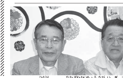
(左から)中沢会長、長井技師