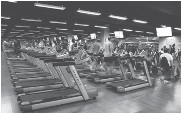
スマートフィットの様子

高級路線と低価格組は健闘 不況を受けて、国内スポーツジムの大手で顧客が減少する一方、ピオ・リチモグループが展開するスマートフィットのような低価格モデルの台頭で価格競争も激化している。業界各社の経営者からは、一様に会員が減少したと話しており、過去12カ月で見ると、サンパウロ市内では35%から40%、リオ市内では15%減少したという。