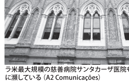
ラ米最大規模の慈善病院サンタカタリナも深刻な経済危機に瀕している。

Bricc 首脳会議などため、テメル大統領が29日に中国に旅行したのを受け、ロドリゴ・マイア下院議長が大統領の代行を務めているが、同日議長の代行は、28歳の新人議員と29日付付字紙・サイトが報じた。