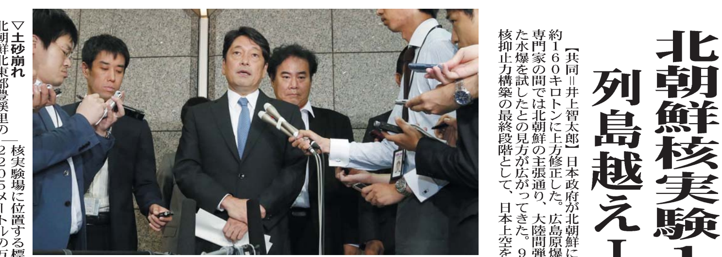
北朝鮮の核実験の爆発規模について話す小野寺防衛相=6日午前、防衛省

【共同】井上智太郎 日本政府が北朝鮮による6回目の核実験の爆発規模を160キロトンと修正した。広島原爆(16キロトン)の約10倍の威力。防衛当局者は、専門家の間では北朝鮮の主張通り、大陸間弾道ミサイル(ICBM)に搭載できるまで小型化した水爆を試したとの見方が広がってきた。9月9日に建国記念日を迎える北朝鮮。米朝対峙の核抑止力構築の最終段階として、日本上空を通過するICBM発射に踏み切る恐れもある。 「共同」井上智太郎 日本政府が北朝鮮による6回目の核実験の爆発規模を160キロトンと修正した。広島原爆(16キロトン)の約10倍の威力。防衛当局者は、専門家の間では北朝鮮の主張通り、大陸間弾道ミサイル(ICBM)に搭載できるまで小型化した水爆を試したとの見方が広がってきた。9月9日に建国記念日を迎える北朝鮮。米朝対峙の核抑止力構築の最終段階として、日本上空を通過するICBM発射に踏み切る恐れもある。