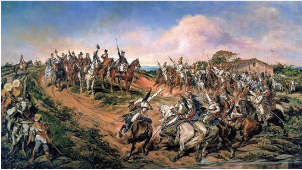
イピランガで独立宣言したペドロ二世 (By Pedro Américo, via Wikimedia Commons)