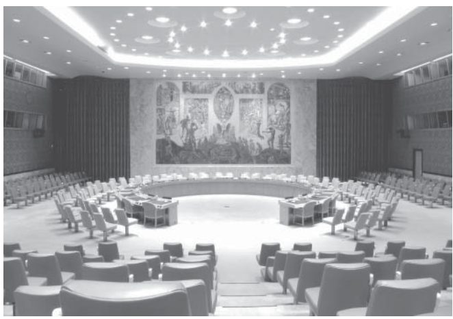
国連安全保障理事会の会議場

なんの効果もなさそうに見える。「抗議」「安保理」に見ても、徐々に強化されている。 日本政府の「北朝鮮対応」は、これでいいのでしょうか？ 皆さんご存知のように、北朝鮮は、8月29日、北海道上空を通過する弾道ミサイルを発射した。 9月3日、核実験を行った。 その後の流れは、いつもと同じ。日本政府高官は、「許しがたい！断じて抗議する！」という。でも、なんの効果もなし。その後、国連安保理が招集され、非難する。なんの効果もなし。制裁が話し合われて、たいていは中国とロシア が反対。それでも、徐々に強化されている。 しかし、北の態度は、変わるところか、ますますアグレッシブになっている。 こういう現状を見て、不満を抱いている人も多いのではないのでしょうか？ とはいえ、この「遅々とした歩み」が、実は「最善の道」なのですか？ ▼国連安保理の欠点 全世界のほとんどの国が加盟している国連。国連の中で、「強制力」をともなう決定が下せるのは、安保理だけです。しかし、欠点がある。 そのいい例が、アメリカのイラク攻撃です。アメリカは、「フセインのイラクには大量破壊兵器がある」と主張して攻撃を開始。この時、国連安保理を無視してはじめた。なぜ？ 常任理事国のフランス、ロシア、中国が、イラク攻撃に反対していたから。この件では、仏口中が正しかった。というのも、結局イラクには「大量破壊兵器が