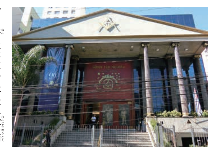
東洋街にあるフリーメイソンのロッジ

だが、それに伴って始まった重税などに対する王室への不満と革命思想が結びつき、18年に