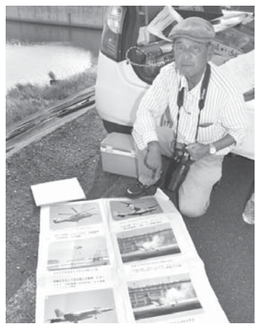
米軍基地、監視続けて5年 「小さな変化見逃さない」

米軍基地、監視続けて5年 「小さな変化見逃さない」 米軍基地、監視続けて5年 「小さな変化見逃さない」 米軍基地、監視続けて5年 「小さな変化見逃さない」