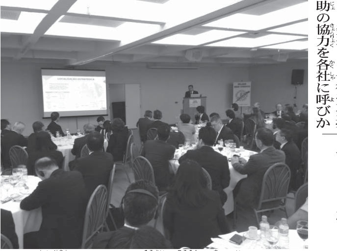
出席者らはネヴェス総裁の講演を聞き入った