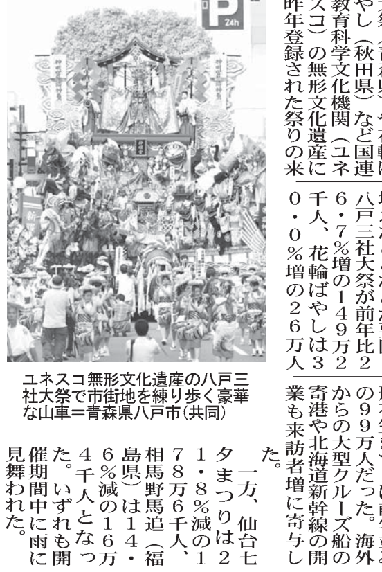
長崎市長ら署名見届け 長崎市長ら署名見届け

長崎市長ら署名見届け 長崎市長ら署名見届け 長崎市長ら署名見届け 長崎市長ら署名見届け