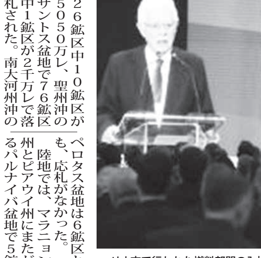
リオ市で行われた燃料部門の入札

深海鉱区のCM346は特に競争が激しく、2位の4億4390万レアルを大幅に上回る22億4千万レアルで落札した。同コンソーシアムは別の鉱区も12億レアルで落札しており、同盆地での落札額は今回の落札総額の95%を占めた。エクソンは単独入札も含めた36億5千万レアルで、岩層下の油田に近入札規定上の最低入札価格(以下、最低価格)の総計7億レアルに対し、落札