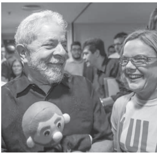
支持率1位のルーラ氏