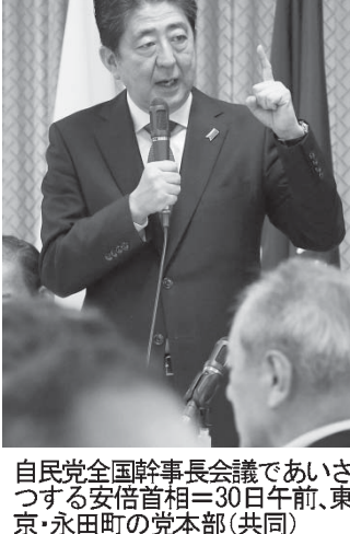
自民党全国幹事長会議で挨拶する安倍首相。30日午前、東京都・永田町の党本部(共同)

【北京、ジュネーブ共同】中国を訪問したティラーソン米副大統領は、北朝鮮の核開発問題を通じて、北朝鮮との緊張緩和を目指す意向を示している。また、この問題の解決には、欧州の舞台が必要であるとしている。