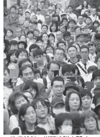
政党幹部の街頭演説を聞く人たち。1日午後、東京都内

【共同】衆院解散後、初めての日曜日を迎えた1日、与野党幹部は各地で街頭演説や集会に臨み、支持拡大に努めた。与党は、北朝鮮対応や経済運営など安倍政権の実績を強調。野党は「安倍1強」のひずみを指摘し、政権批判を繰り返した。