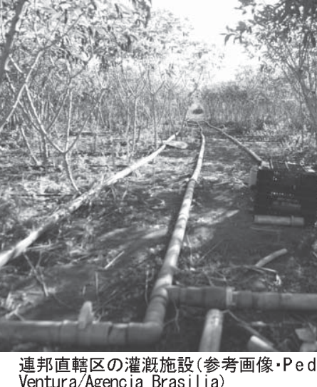
連邦直轄区の灌漑施設(参考画像)

地理統計院(IBGE)が9月21日、2016年の果物の生産額を発表した。16年以降で最高の133億レアルだったと発表