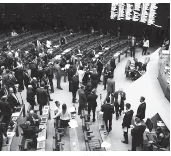
4日の下院の様子