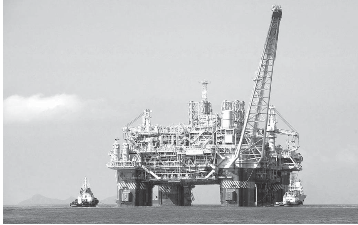
初の純国産海上石油生産プラットフォームP-51

「新聞の三面、社会面」を見ると毎日泥棒や人殺しの話ばかり。それでと一面「政治経済」を開いてみると、次から次へと汚職の話だ。上は大統領から下はファベードまで、議会から裁判所まで一緒に なつてすつたもんだやつていいる。これじゃこの国はダメだ。「私達が若い頃思い描いてきた「希望の国ブラジル」はどこへいつてしまったんだ」皆口々に不満を吐き出しています。でもね、あまり悪い方ばかりあげているとストレスが溜まり、身体によくない。今回はこの暗い気分転換に、ブラジルの良い点、希望の持 ▼発電所 石油鉱区の売却し 9月27日、政府は発電所4箇所と海底にある石油探掘権の入札を実施しました。発電所はミナス電力公社(CEMIG)所有のもので、これの利用権が121億レアルで落札されました。