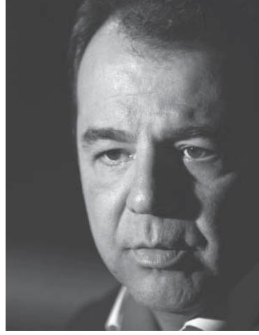
カブラル元リオ州知事

知事時代の汚職が次々と2カ月の禁固刑を言い渡されたりオ州元知事のセルジオ・カブラル被告(民主運動党・PMDB)の豪邸が競売にかけられる事になった。裁判所の命令で競売を