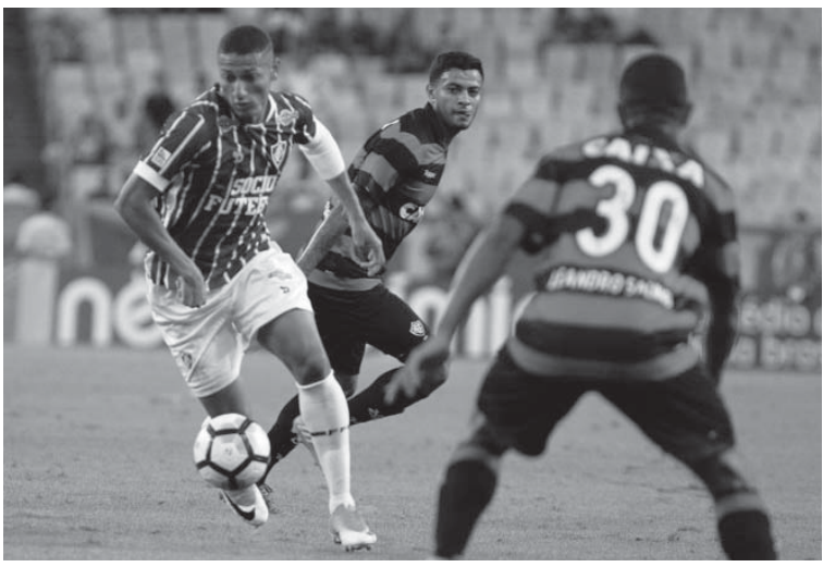
フルミネンセ時代のリジャールソン

現在サッカーブラジル代表はW杯南米予選の最終戦を目前に控えている。既にW杯進出を1位通過で決めているブラジル代表は、選手がほぼ固定されている印象だが、まだ虎視眈々と代表入りを狙っている有望若手選手が存在する。