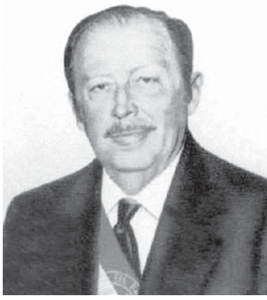
ストロエスネル大統領