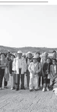
「三角関係」の前で記念写真を撮る一行

ポルトガル3日、9月19日の午前、大航海時代に世界へ船出した出発点、テジジョ川沿いにあるリスボン市内のペレン地区へ向かった。インド航路を発見したヴァスコ・ダ・ガマは1497年にここを立ち、ブラジルに1500年に到着したペドロ・ア