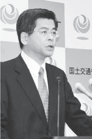
石井国交相は記者会見で「日本のものづくりに対する信頼を揺るがす事態だ」と懸念を表明した。=20日午前、国交省

【イスタンブール共同】シリアの少数民族クルド人主体の民兵組織「シリア民主軍（SDF）」は20日、過激派組織「イスラム国（IS）」が「首都」と称してきた北部ラッカを奪還したと正式に発表、勝利宣言した。シリアのISとの戦いは「最終章」に入ったと強調した。ISに近く下がる場面もあった。平均株価は一時100円近く下落したが、米上院で予算案が可決されて外国為替市場で円相場が1ドル113円台に下落すると、輸出関連銘柄などに買が入り、上昇して引けた。