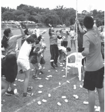
大人も子供も楽しんだ玉入れ

アマゾン州マナウス市のマナウス・カントリクラブで8日、「第26回マナウス大運動会」が行われた。元々移住地で開催されていたのが引継がれた行事で、集まった約200人の参加者は、雨天で途中中止になるまで汗を流した。運動会は西部アマゾン日伯協会とカントリク