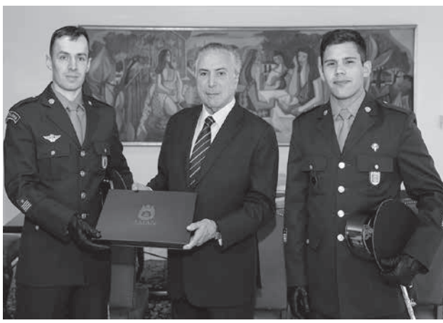
25日のテメル大統領

25日に、テメル大統領が、7、8月の1度目の領への2度目の告発受け入れ(最高裁での審理承認)に関する下院での全議会議決と投票が行われた