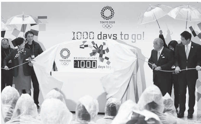
2020年東京五輪開幕千日前の記念イベントで披露されるカウントダウンボード=28日午後、東京・日本橋

【共同】2020年東京五輪の開幕まで28日となったが、事前合宿の誘致といった取り組みでは自治体間にまだ差がある。共同通信の全国アンケートでは4割近い市区町村が「関心はあるが、関連事業に取り組みつもりはない」と回答。今後ルートが決まる聖火リレーなどで遠隔地や小さな自治体も巻き込んだ全国的な機運醸成が求められる。