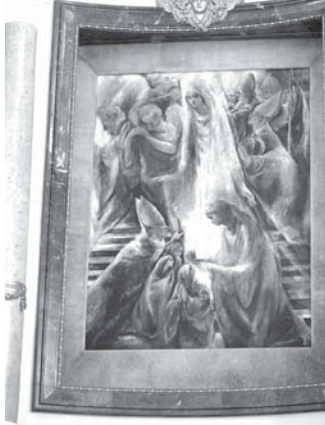
聖母が子供3人に語りかける様子が大聖堂の最奥部に飾られている