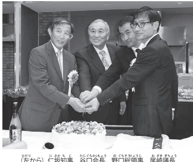
（左から）仁坂知事、谷口会長、野口総領事、尾崎議長

仁坂知事や中南米三方国からも 聖州議会におよそ400人 ブラジル和歌山県人会（谷口ジョゼ一朗会長）は、和歌山県人ブラジル移住100周年記念式典を29日、聖州議会で開催した。母国の仁坂吉伸知事や尾崎太郎議長をはじめ、メキシコ、ペルー、アルゼンチンの同県人会から延べ20人以上の慶祝団が駆けつけ、およそ400人の関係者が盛大に節目の年を祝った。 式典は、和歌山県人ブラジル移住100周年記念式典を29日、聖州議会で開催した。母国の仁坂吉伸知事や尾崎太郎議長をはじめ、メキシコ、ペルー、アルゼンチンの同県人会から延べ20人以上の慶祝団が駆けつけ、およそ400人の関係者が盛大に節目の年を祝った。