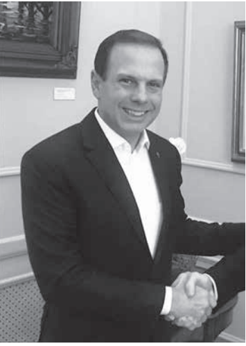
ジョアン・ドリア市長 (@jdoriajr)

最も酷いプロデューサーの一人」などと発言。これらも行政における秘密保護の原則に抵触する。ドリア市長は「市だとして、不正行政や背任の可能性も」