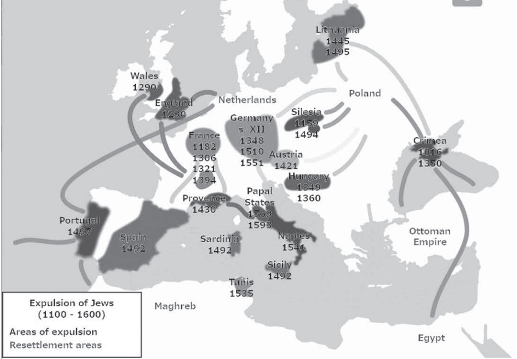
1100年から1600年にかけてのヨーロッパにおけるユダヤ人の追放による民族移動を示す地図

私が見るところ、覇権には、地域覇権と世界覇権の2種類がある。近代以前の言い方をすれば、地域帝国と世界帝国の2種類だ。 地域覇権・地域帝国は、強い国が、自国の周辺(もしくは経済的思想信条的につながりがある)弱い国を支配するものだ。強い国の視点に立てて存在している。これと対照的に、世界覇権・世界帝国は、先に「世界」という枠組みが存在し、その全体をどうやって支配するかという戦略やランドデザインの問題になる。 ▼地域覇権・地域帝国