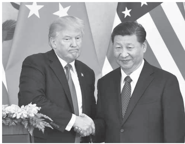
共同記者発表で握手するトランプ米大統領(左)と中国の習近平国家主席=9日、北京の人民大会堂(共同)

戦略欠如、守勢トランプ氏 28兆円の商談成立 【北京共同】菅田晋一郎、清水敬善「トランプ米大統領が9日、中国の習近平国家主席と北京で会談した。両首脳は北朝鮮非核化や米中の貿易不均衡を正に向けた協力を確認したが、目立ったのは権力基盤を盤石にした習氏の余裕。今世紀半ばまでに米国と肩を並べる「超大国」となることを目指す習氏は、米主導の国際秩序組み替えへの野心を隠さない。攻め込まれるトランプ政権は長期的なアジア戦略に欠け、守勢に回る。」