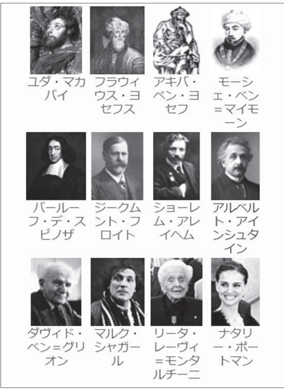
代表的なユダヤ人

【共同】天皇、皇后陛下主催の秋の園遊会が9日、東京・赤坂の赤坂御苑で開かれ、各界の功労者約2千人が出席した。昨年リオデジャネイロ・パラリンピックで活躍した選手らも招待され、両陛下がねぎらいの言葉を掛けられた。皇太子ご