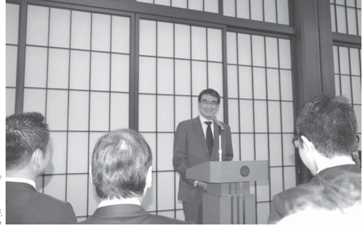
10月24日、外務大臣主催レセプションで挨拶する河野太郎外相(外務省飯倉公館)

新たなネットワークを構築し、日本との架け橋になります。私たち日系ユースにとつて「TOKYO 2020」は、母国において日本への注目が高まる