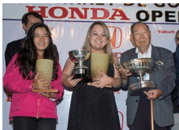
8回目の優勝を飾ったジリオットさん(中央)