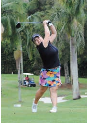
ジリオットさんのティーショット

目的とする本大会。日系人との配偶者に出場資格があり、北はチカウス、ペレン、南は南大河州など全伯から参加者が集まった。2日間で36ホールの合計スコアで勝敗を競うストロークプレー方式で行なわれた。