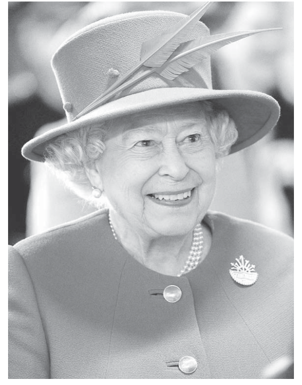
エリザベス2世(2015年3月に撮影)