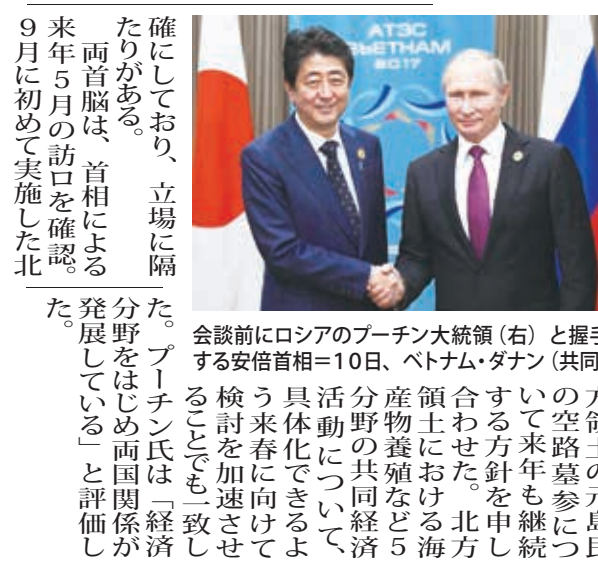
安倍首相(左)とプーチン大統領(右)は10日、ベトナム・ダナンで会談した。両首脳は、首相による9月に初めて実施した北

【ダナン共同】鈴木邦男外相は10日午後、ベトナム・ダナンでプーチン大統領と会談した。核・ミサイル開発を進める北朝鮮への圧力強化のため、国連安全保障理事会の制裁決議を厳格に履行する方針を確認。北方領土の共同経済活動に伴う一人の移動の法的枠組みを巡る協議を進めるため、年内に作業部会を開催し、来年早々に次官級協議を開くことも合意した。 会談で首相は、北朝鮮の非核化に向けた連携について話し合いたい」と述べた。「最大の圧力」を加える必要があるとの考えも伝えたこととみられる。プーチン氏はこれまで対話重視の姿勢を