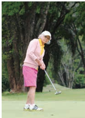
繊細なパッティングを見せる90歳の東さん