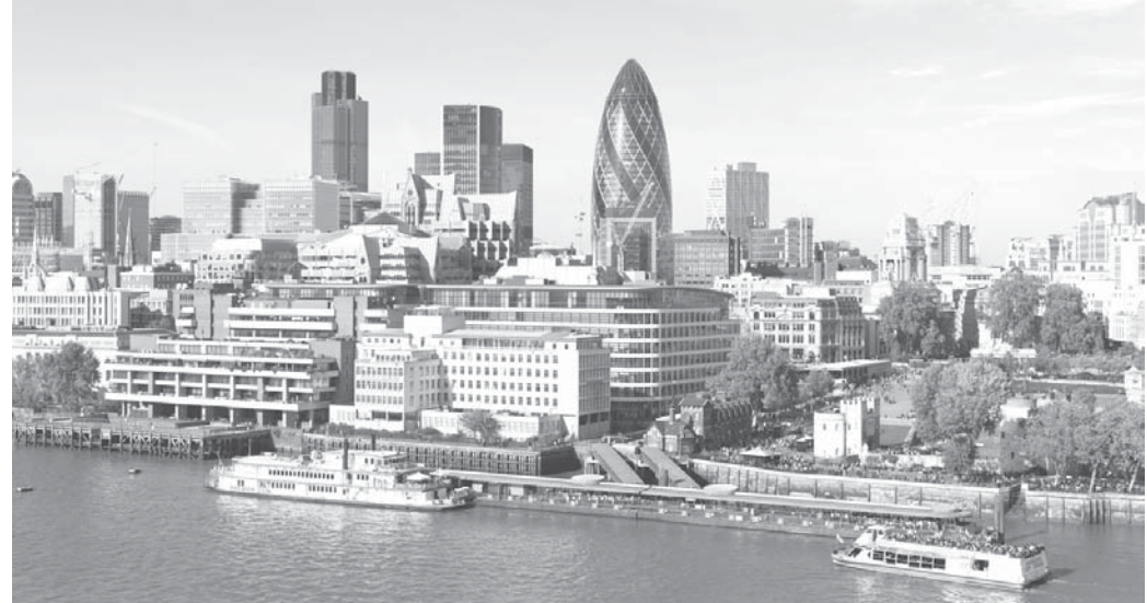
ロンドンの町並み