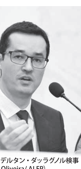
LJ作戦を統括する、デルタン・ダラグル検事

予定総額のほんの13%。式典では、レニエンシアの成果と検察。資金の返還は、個人による報復付供述や企業版による報復付供述であるレニエンシアによって実現した。正式に承認されたレニエンシアには、建設大手のオデブレヒト社やアンドラーデ・グティエレス社が行った供述が含まれている。