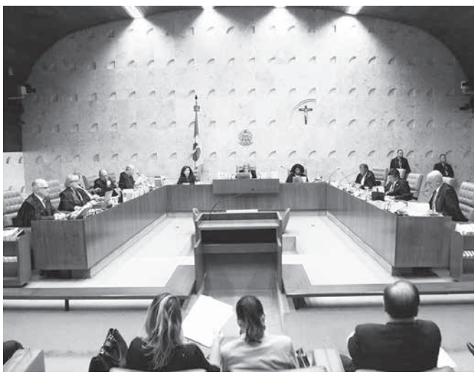
7日の最高裁

この問題はアエシオ(会党・PSDB)が収賄(ネーヴェス上議(民主社)容疑での職務停止となつて)