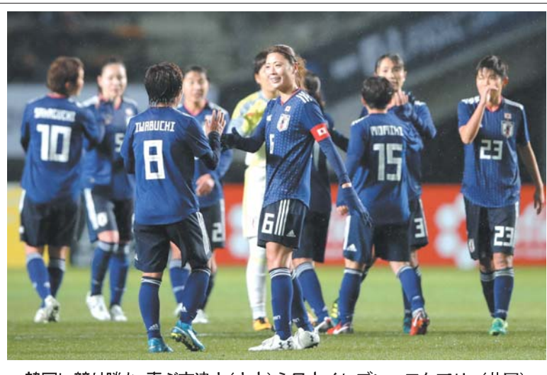
韓国に競り勝ち、喜ぶ宇津木(中央)ら日本イレブン=フクアリ

【共同】サッカーの東アジアE-1選手権は8日、千葉市のフクアリで開幕して女子の2試合が行われ、日本代表「なでしこジャパン」は韓国に3-2で競り勝って自星スタートを切った。