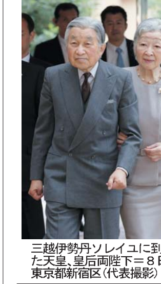
三越伊勢丹ホールディングスに到着された天皇、皇后両陛下(8日午前、東京都新宿区)(代表撮影)(共同)

【共同】天皇、皇后両陛下は8日、東京都新宿区にある三越伊勢丹ホールディングスの関連会社を訪れて障害者が働く様子を視察し、ねぎらわれた。到着した両陛下は会社前に集まった人々に「おはようございます」と挨拶し、手紙を渡した。訪れたのは三越伊勢丹ホールディングスの従業員、百貨店で使うラッピング袋の作製や伝票の分類などの業務を行っている。