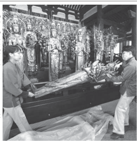
修復が終わり、三十三間堂に搬入される観音像=22日午前、京都市

【共同】京都市東山区の三十三間堂の国指定重要文化財「千体千手観音」の修復が完了した。1001体のうち最後の9体が22日、搬入された。修復は1973年度に始まり、約45年かけて完了した。