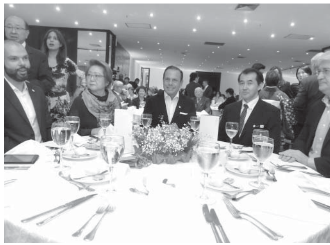
聖市行政関係者と食事を共にして懇親を深めた