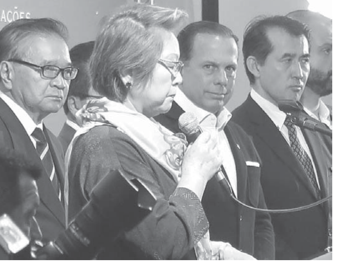
日系諸団体を代表して呉屋会長が挨拶に立った