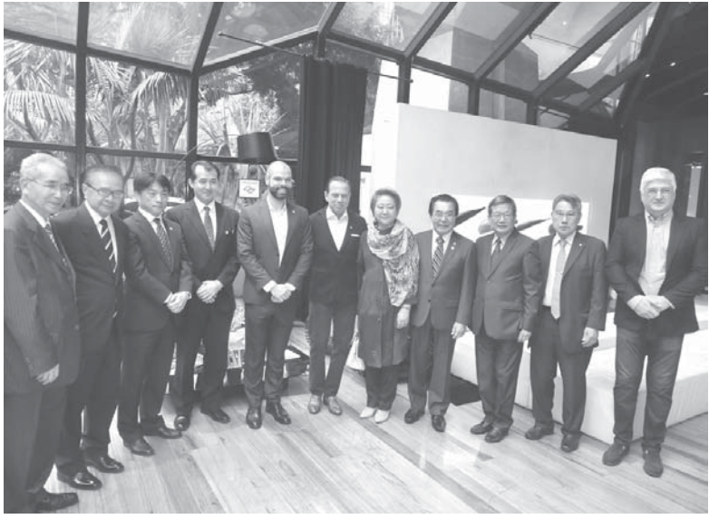
ホテル内ロビーで主要日系団体代表者がドリリア市長を歓迎