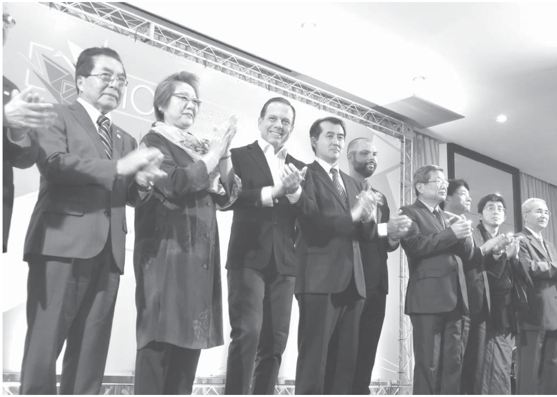
会場からの熱烈な歓迎に笑顔で応えるドリリア市長