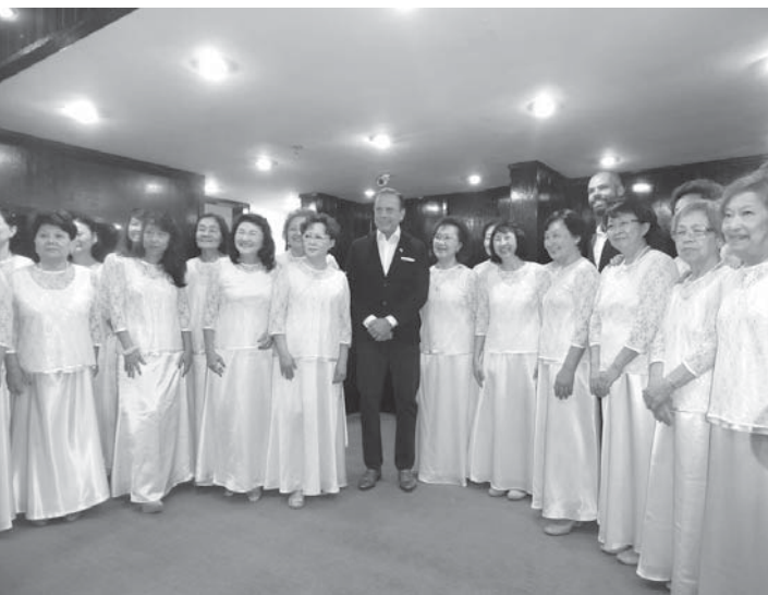
文協女性コーラス部の出迎えに笑顔を見せた