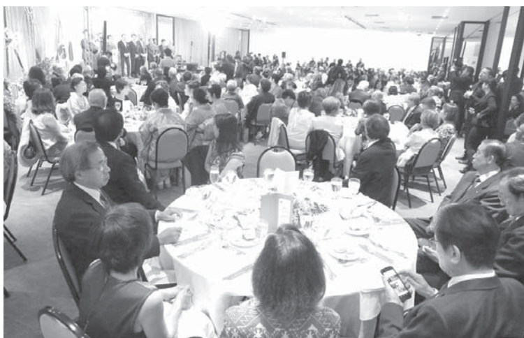
式典には380人が詰めかけ、満員御礼となった