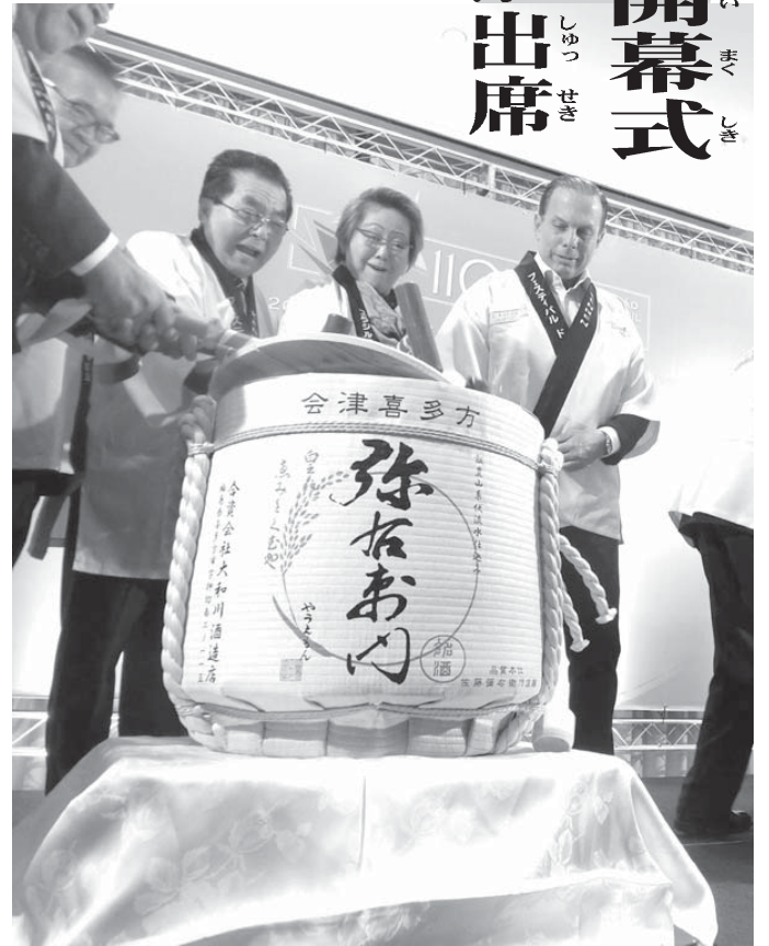
福島県喜多方市を本拠とする1790年創業、大和川酒造の「弥右衛門」で鏡割り