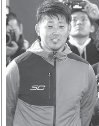
中日に入団が決まり、笑顔で取材に応じる松坂大輔投手。23日午後、ナゴヤ球場(共同)

【共同】米大リーグ、ヤンキースの田中将大投手が23日、古巣プロ野球楽天の本拠地、仙台市大田区にあるパーク宮城で自主トレを公開した。この自主トレは、楽天の監督である田中が、田中将大投手の自主トレを公開し、開幕投手に意欲を示した。 田中将大投手は、楽天に入団してからは、この状況に逆手に取って、17日から23日まで、この自主トレを公開し、開幕投手に意欲を示した。