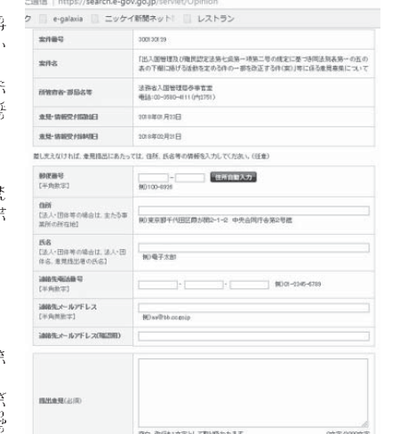
四世ビザに関する意見を書き込むページ

パブリックコメントの意見は日本語（ひらがなでも可）に限る。個人の意見は氏名・住所等の連絡先、法人なら法人名・総務窓口（e-Gov、E-mail: nu/120）、電子メールアドレス（nu@nu.mof.go.jp）、法務省出入国管理局参事官宛て、郵送（〒100-8511、東京都千代田区霞が関1-1-1、法務省入国管理局参事官宛）に封筒に赤字で「パブリックコメント（日系四世受入れについて）」と記載することも可能。