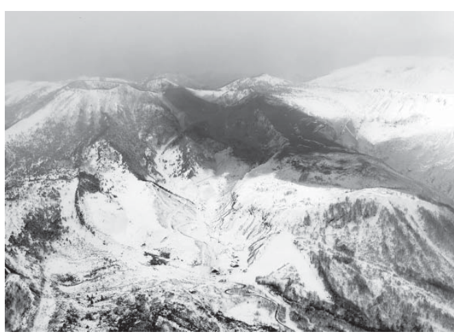
草津白根山の白根山が噴火し、火山灰で覆われた山頂付近。中腹はスキー場。23日午後0時10分。群馬県草津町