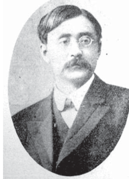
新渡戸稲造

海軍省へ士官候補生の教育プランへの編入を告げた。省はそれを認め、2人のインストラクターの雇用を承認した。