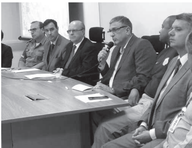
判決当日の警備体制に関する記者会見 (Porto Alegre, RS - 22/01/2018,)