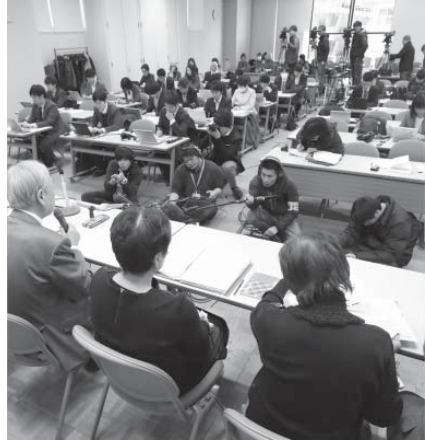
旧優生保護法を巡り、記者会見する原告の女性（手前中央）。賠償を求め、国を初提訴した宮城県の女性（手前中央）。

【共同】旧優生保護法（1948〜96年）で知的障害を理由に不妊手術を強制された宮城県の60代女性が「重大な人権侵害」に、立法による救済措置を怠ったとして、国に1100万円の損害賠償を求める訴訟を30日、仙台地裁に起こした。旧法を巡る国家賠償請求訴訟は初めて。「憲法が保障する自己決定権や法の下の平等原則に反する」と違憲性を主張する方針。