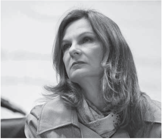
アナ・パウラ・ヴェスコヴィ国庫庁長官

基礎的財政収支は、国庫、中銀、社会保障費の国庫、中銀だけで見ると、収支は580億レアルの黒字だが、社会保障費が単体で1824億レアルの赤字を出しており、3部門合計の収支が1244億レアルの赤字になった。