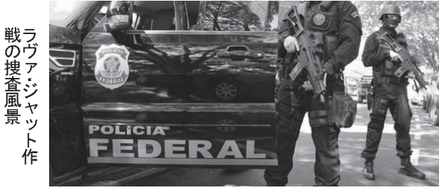
ラヴァジャット作戦の捜査風景

大企業の司法取引やエリート汚職告発といったニュースが、ここ数年で取り沙汰されるようになってきた。大企業の社員の間で内部告発するケースが増えている。コンプライアンス分野のコンサルティング会社ICTSアウソウシニングが明らかにした。国内の企業告発に関連して200以上の告発窓口を担当している同社によると、2014年から17年にかけて、告発件数は50%以上増加した。告発者の匿名性を最大限に確保するため、アウソウシニングは社外に告発窓口を設けるケースが増えている。ただ、企業が告発に対する対応も迅速化しているという。今回の調査では、5年以上にわたって窓口を開いている50社に注目。最も多い告発は対人関係に関するもの(職権の乱用から嫌がらせまで)で、2017年の場合、告発全体の43%を占めた。続いて多かったのは、詐欺やその他の違法行為のような不正で34%。規則違反も告発の4分の1を占めた。ICTSによると、ヴァ・ジャット作戦がはじまって以降、内部告発に対する意識は劇的に変化したという。同社がコンサルタント事業をはじめた2007年、内部告発に対する「軽蔑的な見方」を低減するため、告発窓口には「コンフィデンシャル・チャネル」という名称を使用していた。だが、現在、情報提供者は労働環境に対して貢献しているという意識が芽生えている。腐敗行為防止法が可決した2013年以降、内