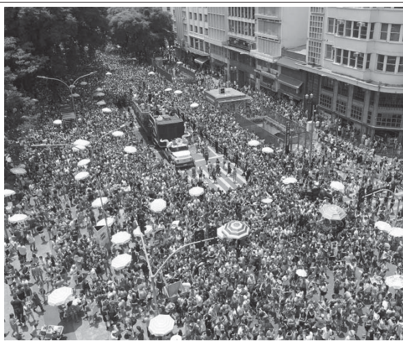
今年のサンパウロ・ストリートカーニバルは大盛況だった。

2月3日から始まったブレ・カーニバルから、9月13日の本格的なカーニバル期間までに、サンパウロ市で行われたパレードに参加した人々の数は900万人を超えたと、14日にサンパウロ市役所が発表した。