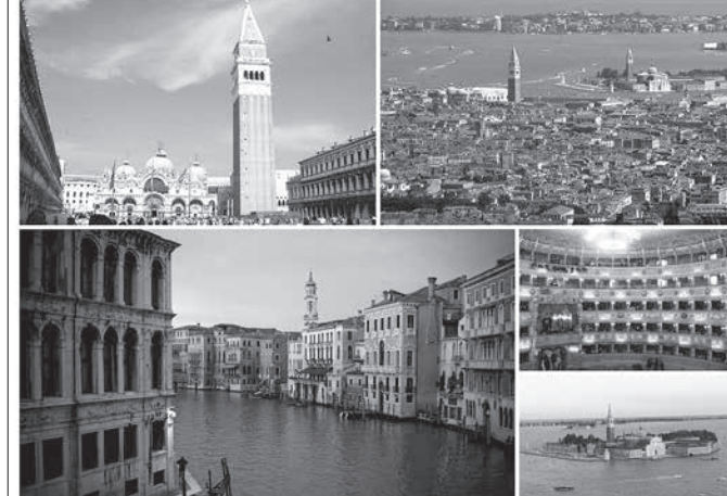
ヴェネツィアの風景 (wikipediacommons)

※これを読めば自然に、日本の文化や歴史に関心をもてるような話を毎週掲載しています。より多くの二世の方や日本語学習者に読んでもらい、少しでも日本に興味を持ってもらえるよう、最奇りの日本語学校や日系団体の掲示板に張ったり、普段は邦字紙を読んでいない兄弟や子や孫などに記事を紹介してください。 (ニッケイ新聞編集部)