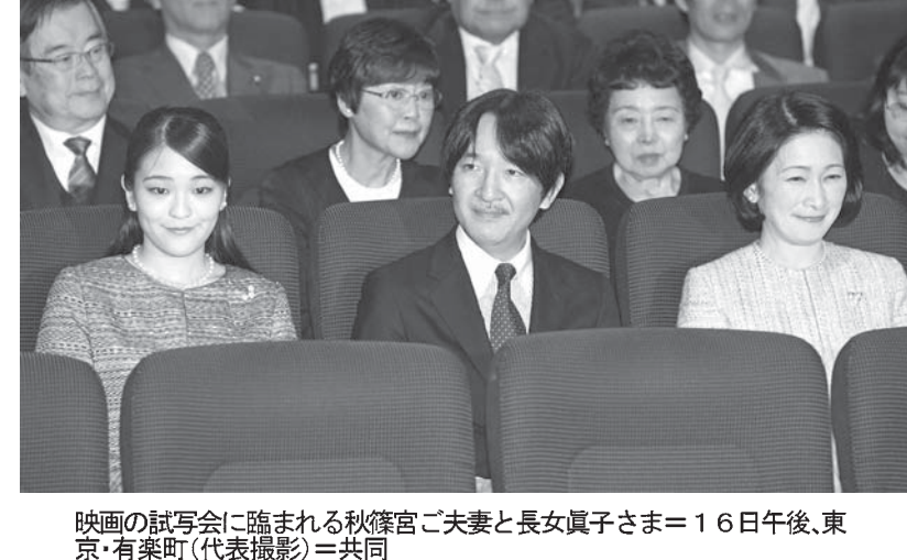
映画の試写会に臨まれる秋篠宮ご夫妻と長女眞子さま=16日午後、東京・有楽町(代表撮影)=共同

【共同】秋篠宮夫妻と長女眞子さまは16日、東京・有楽町の映画館「ヒューマン・トラスト」で、東宝映画「陽菜とLife Goes On」を観賞された。眞子さまは2016年7月から約10カ月間、宮城県石巻市や南三陸町、岩手県