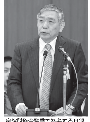
衆院財務金融委で答弁する日銀総裁の黒田東彦氏（16日午前）

【共同】政府は16日、4月に任期の切れる日銀総裁に黒田東彦氏（73）を再任させる国会意思を衆参両院の議院運営委員会に提示した。衆参両院とも自民、公明の与党が過半数を占めており、所信聴取を経て可決、承認される公算が大きい。再任されたら、山際正道氏（在任期間1956〜64年）以来、半世紀ぶりに在任期間が5年を超える異例の総裁となる。3月に任期切れを迎える副総裁に雨宮正佳日銀理事（62）と若田部昌博大教授（52）を充てる人事も示した。任期は正副総裁いずれも5年間。