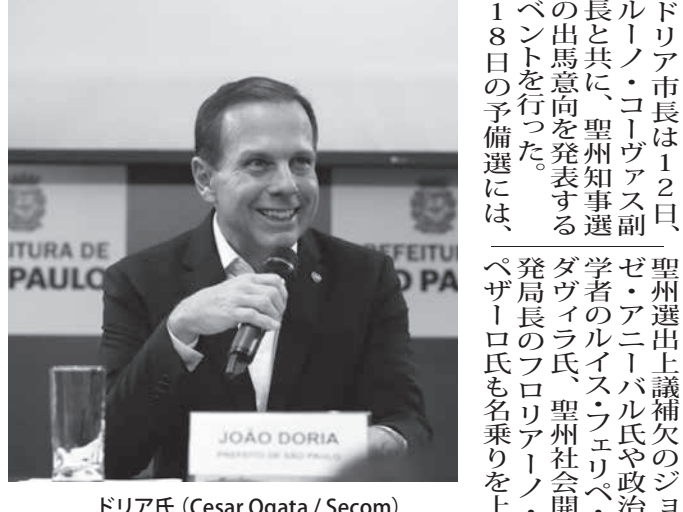
ドリア氏

ジョアン・ドリア聖州市長(民主社会党・PSDB)は12日、10月に行われる聖州知事選への出馬希望を公式に発言し、18日にPSDB聖州支部で行われる候補選出のための予備選に正式に名乗りをあげた。既に強力に調整も進んでおり、PSDBの候補になることも有力な状況だ。13日付伯字紙が報じている。