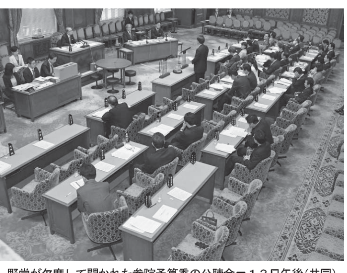
野党が欠席して開かれた参院予算委の公聴会=13日午後

【共同】学校法人「森友学園」への国有地売却に関する決裁文書改ざんをめぐり、与野党対立が13日、拡大した。与野党は参院予算委員会での集中審議を決定した。