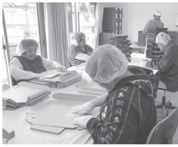
B型事業所「ほたる」でクッキーの箱折りをする障害者＝鳥取県米子市

【共同】障害者に働く機会を提供する国の就労継続支援事業のうち、雇用契約を結ばない「B型事業所」。重い障害の人も含められることから「仕事場」よりも「居場所」の意味合いの強い事業所が多い中、経営の工夫で賃金を高める所が出始めた。仕事のやりがいを重視した試みが注目されている。