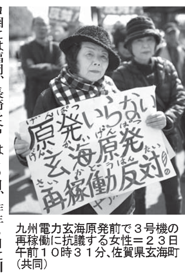
九州電力玄海原発3号機(佐賀県玄海町)の再稼働に反対する市民ら(共同)

【共同】九州電力玄海原発3号機(佐賀県玄海町)が23日、再稼働した。原発の安全対策を徹底した新規制基準下での再稼働は、14日の関西電力大飯3号機(福井県おおい町)に続き5原発7基目。東日本大震災から7年がたち、電力供給面で原発回帰が鮮明になりつつある。九電は当面、電気料金を据え置く方針。