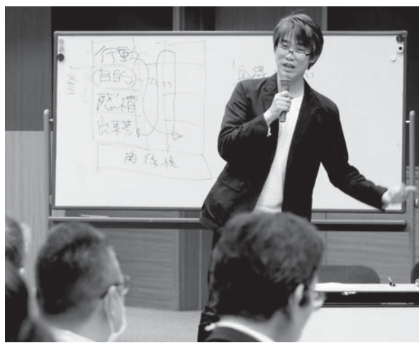
演劇の創作手法について語る演出家の板垣恭一＝東京・霞が関

【共同】演劇で行われる人と人とのコミュニケーション。その考え方や手法を仕事や介護などに生かしてもらおうというワークショップが行われた。人間関係を構築し、円滑にするヒントとは。