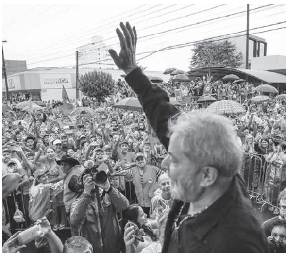
27日のルラ氏

同州のランジェイラ・ス・ド・スルに向かった。ルラ氏一行は、パラナ州ケダス・ド・イグアスで起きた。キャラバンではバスが