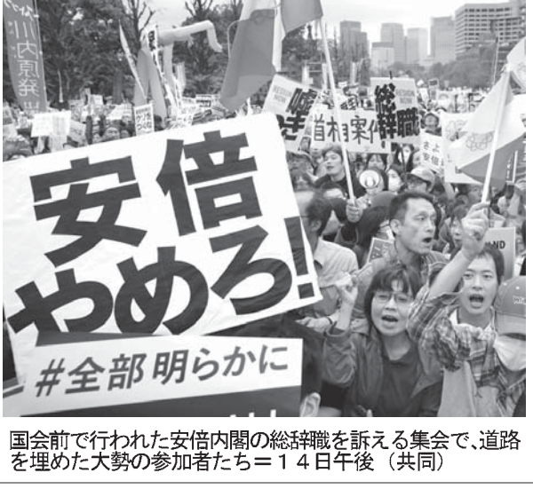
国会前で安倍内閣の総辞職を訴える集会で、道路を埋めた大勢の参加者たち。14日午後

【共同】素材メーカーが人手不足でフル生産できず、製造業に波及している。人手不足は深刻化している。