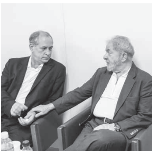
シロ・ゴメス氏(左)とルラ元大統領(右)

15人への嫌疑は、ラ・ヴァ・ジャット(LJ)で被告人となり裁判中、有罪判決、控訴中、服役中など様々だ。LJ作戦の標的になった者も少なくない。LJ作戦の標的になった者も少なくない。LJ作戦の標的になった者も少なくない。