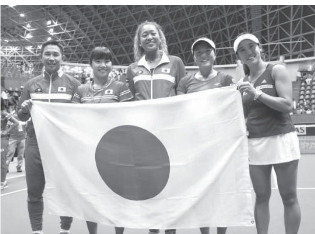
英国を破ってWG2部復帰を決め、日の丸を手にする(左から)土橋登志久監督、奈良くるみ、大坂なおみ、二宮真琴、加藤未唯＝フルボンビーズドーム(共同)