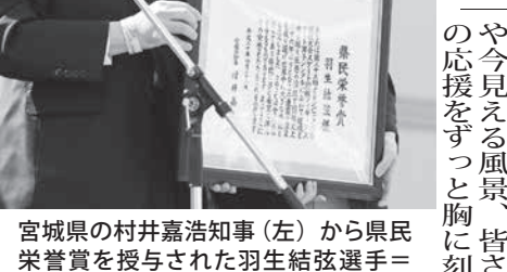
宮城県の村井嘉浩知事(左)から県民栄誉賞を授与された羽生結弦選手＝22日午後、仙台市

【共同】平昌冬季五輪で6年ぶりの2連覇を達成した羽生結弦選手(23)のパレードが22日、地元仙台市で行われ、道沿いを埋め尽くした市民や全国から訪れたファンら10万8千人(主催者発表)が「勇気」と希望をあげながら、祝福した。羽生選手は連覇を以て「たいたいたい」と胸に刻んだ。