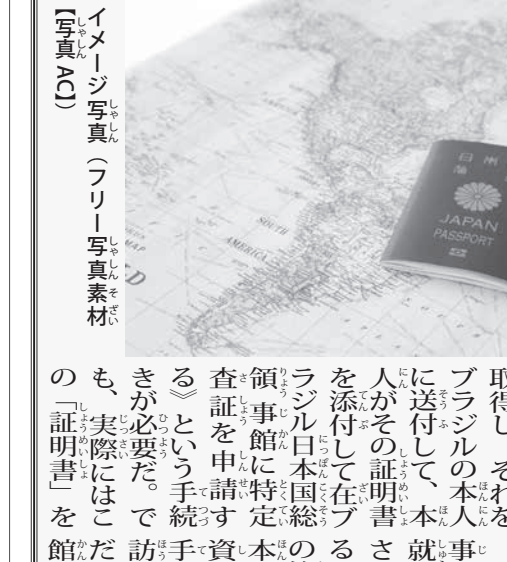
イメージ写真

野党、審議拒否で抗戦 参院決算委員会は23日、民進、共産両党などが欠席する中、自民、公明両党と日本維新の会が出席し、2016年度決算の審査を行った。