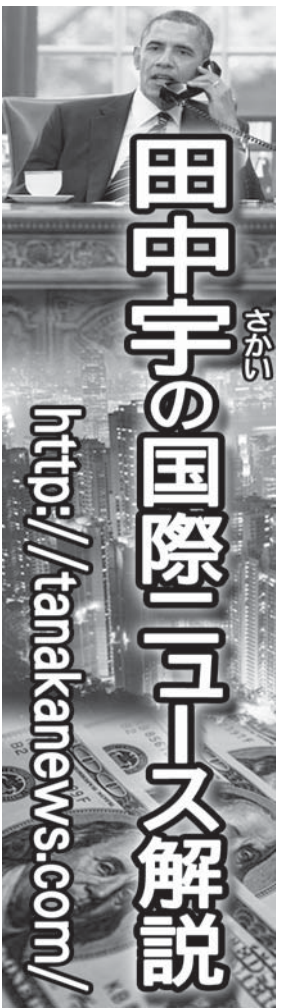
田中宇の国際ニュース解説