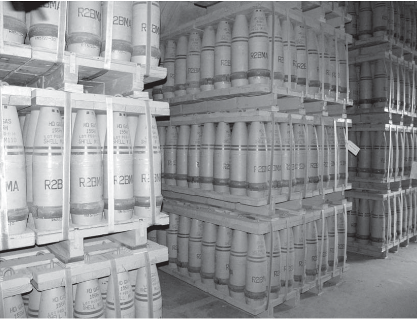
米軍に貯蔵されている化学兵器の一種「マスタードガス弾」

2011年からのシリア内戦では、化学兵器による攻撃が何度も行われている。ウイキペディアによると、直近のドゥマの化学兵器攻撃(劇)まで、合計72回、化学兵器が使われた。