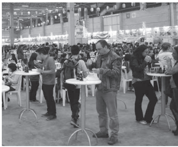
昨年の郷土食コーナーの様子。今年はさらにパワーアップ!