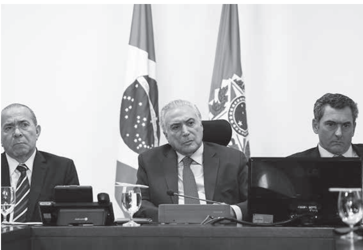
24日のテメル氏

テメルの支持率が上がる場合 聖州知事選でスカツファイ牽制 10月の大統領選は候補乱立状態だが、テメル大統領の支持率が上がらない場合は、民主運動(MDB)関係者が、民主社会党(PSD)のジェラウド・アウキミン氏の支持に回る可能性が出てきている。24日付伯字紙が報じている。