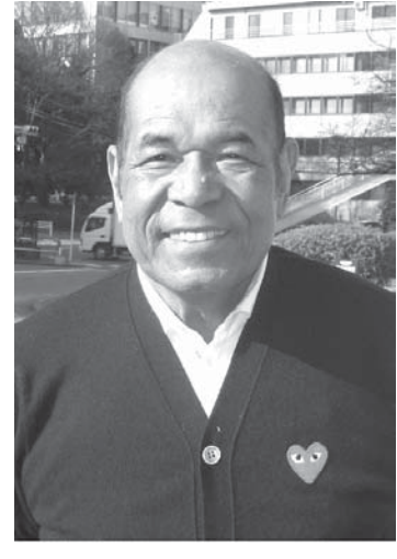
死去した衣笠祥雄氏

【共同】プロ野球広島を巻き起こした。76年の中軸打者として活躍し、プロ野球記録の2215試合連続出場、鉄人と呼ばれた国民栄誉賞も受賞した衣笠祥雄(きぬがさ・さちお)氏が23日夜に上野区で死去した。71歳。京都府出身。関係者が24日明らかにした。 京都・平安高(現龍谷大平安高)で1964年、捕手として甲子園大会に春夏連続出場。65年に広島に入団し、内野手に転向。75年に山本浩二氏とともに中軸を担ってセ・リーグ初優勝に貢献し「赤ヘル旋風」