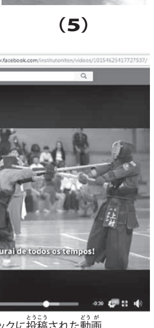
フェイスブックに掲載された動画