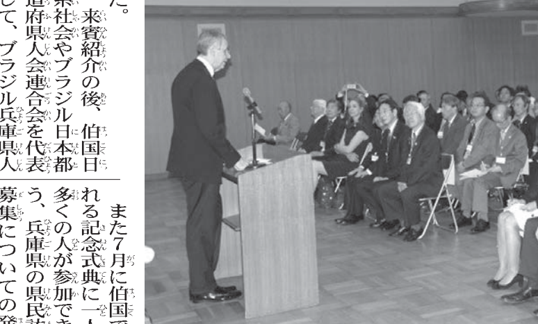
アンドレア・コレア駐日大使

また7月に伯国で行われる記念式典に一人でも多くの人が参加できるように、兵庫県の県民訪問団募集についての発表があった。