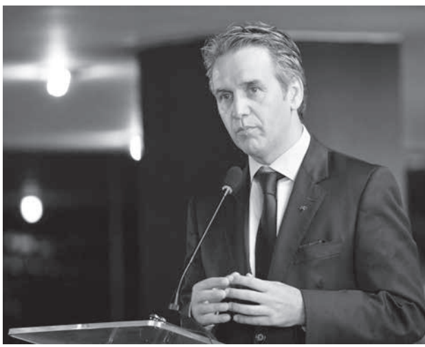
イアゴロ・マルチンス国税庁副長官

国税庁はこれまでに、を行って、不正関与の可能性がある疑われる可能性の強い公務員を、20万人に関する調査だ。今回結成された捜査班は、これら8000人のデータを精査すること、今月末までに犯罪行為に干渉した人物や、役職、犯罪行為の概要を把握し、新たなオレ・レ・シヨンの対象者を絞り込む意向だ。