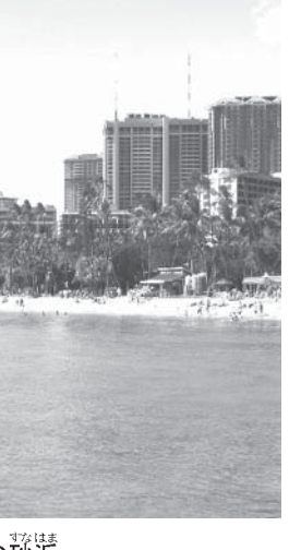
ワイキキビーチは人工の砂浜

ワイキキとはハワイ語で「水が湧くところ」の意味で、ハワイ王朝の領土であった。それまで白人の所有となっていたが、1920年代から1930年代に、オアフ島北部やカリフォルニアから白砂を運んで造られた人工の砂浜である。