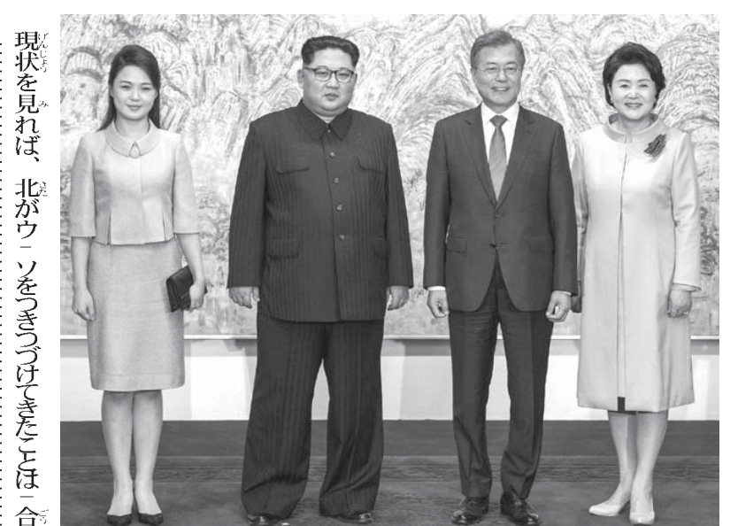
北朝鮮と韓国のトップ会談

「金正恩の意図」 金正恩の父・金正日は、こうやって世界を欺いてきました。1994年6月、北朝鮮は、NPTからの脱退を宣言した。同年10月、米朝合意、アメリカは、北に軽水炉、食料、重油を提供し、「核開発凍結」を約束しました。 ところが、北はウソをついて、核開発をつづけた。2003年、北朝鮮は、NPTを脱退した。2005年2月、北朝鮮は「核保有宣言」した。同年9月、北は「すべての核兵器を廃棄する」と宣言した。