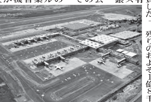
ヴィラコッポス空港

ブラジル政府は、アルゼンチンで予定される大規模な鉄道車両調達入札に、ブラジルが支援する。この入札は、アルゼンチン政府がブラジルに依頼した。