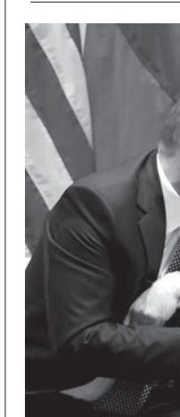
プーチン大統領と話し込むトランプ大統領

「金正恩の意図」 金正恩の父・金正日は、こうやって世界を欺いてきました。1994年6月、北朝鮮は、NPTからの脱退を宣言した。同年10月、米朝合意、アメリカは、北に軽水炉、食料、重油を提供し、「核開発凍結」を約束しました。 ところが、北はウソをついて、核開発をつづけた。2003年、北朝鮮は、NPTを脱退した。2005年2月、北朝鮮は「核保有宣言」した。同年9月、北は「すべての核兵器を廃棄する」と宣言した。