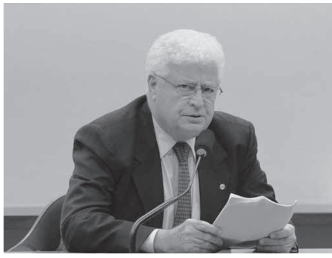
メウレール下議

10月に行われる統一選挙において、ラヴァ・ジャット作戦の捜査対象になっている下院議員のうち、91%が何らかの選挙に出馬すると、15日付エスタド紙が報じている。