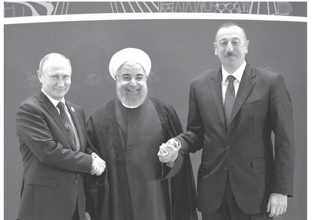
関係を緊密化させる3国首脳、プーチン露大統領、イランのハサン・ロウハーニー大統領、アゼルバイジャンのイルハム・アリエフ大統領