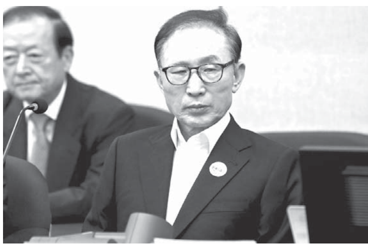
初公判で被告席に着く韓国の元大統領、李明博被告＝23日、ソウル中央地裁

【ワシントン共同】米国防総省が北朝鮮の核実験場を衛星写真から分析し、展望台も設置されていると分析を発表した。天候が許せば数日以内に実験場の廃棄が実施されるとしている。北朝鮮は23日、最新の衛星写真に基づき、北朝鮮東部の豊溪里で核実験場の廃棄に向けた準備が進み、外に設置されていると分析を発表した。天候が許せば数日以内に実験場の廃棄が実施されるとしている。