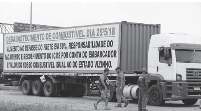
リオ州の国道でストを行っているトラック運転手たち

燃料価格高騰は、昨年7月にPBが採用した原油の国際価格や為替相場の変動に依り、国内の燃料価格を大幅に引き上げた。燃料価格引き下げの義務が政府に課せられた。燃料価格引き下げの義務が政府に課せられた。燃料価格引き下げの義務が政府に課せられた。