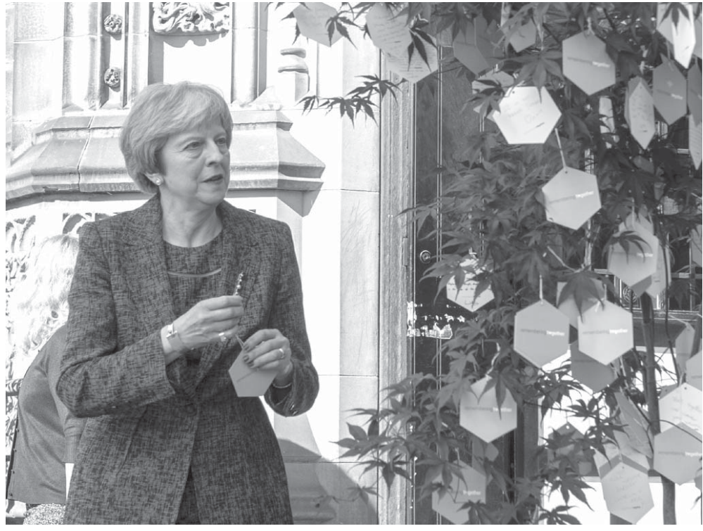
英国のテレザ・メイ首相