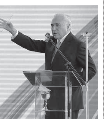
22日の記者会見で

軍警は二人組に相乗りして、巡邏隊の中で起きた。軍警は二人組に相乗りして、巡邏隊の中で起きた。軍警は二人組に相乗りして、巡邏隊の中で起きた。