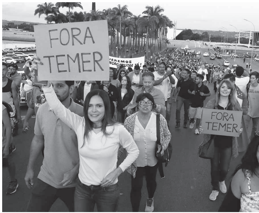
28日、ブラジリアの大統領府前で抗議運動をする人々たち

混乱の続くトラック・ストは29日9日目を迎えたが、ここに来て、スト参加者たちが「軍による政府介入」など、ストの争点と直接関係ない方向に脱線をはじめ、抗争が政治的な色合いを強めている。28日付付伯字紙、サイトが報じている。