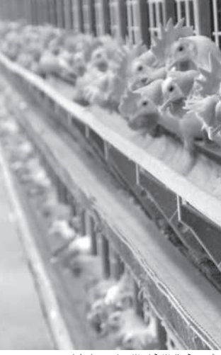
各地の日系養鶏場が危機に晒されている

を上げる栄養素のため、それがなくなり、卵殻の硬度が下がると、困惑している。同移住地内に玉蜀黍農場があるため、当面餌料には困っていない。卵の出荷は同移住地から50〜60キロ圏内で、自前で輸送するため、卵が養鶏場内に溜まること