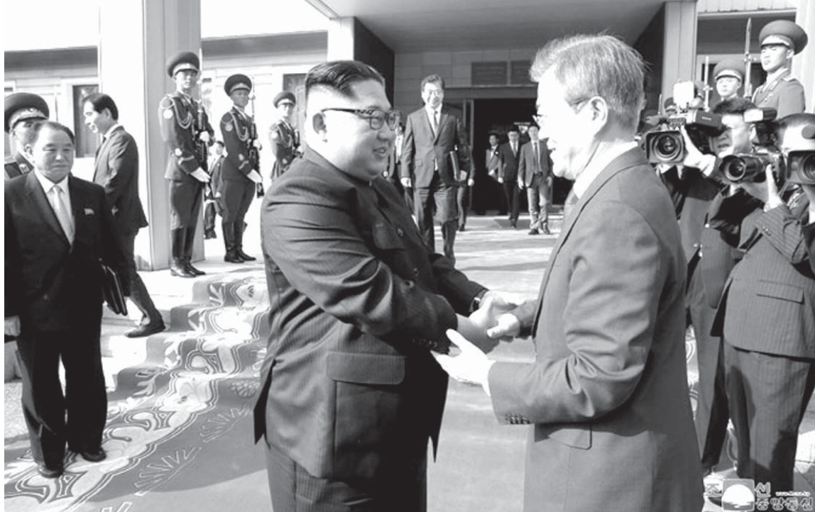
2回目の南北首脳会談の様子

かっただけで、さらに信頼が損なわれたと指摘している。 「(国際監視団を立ち会わせる)約束はほかにされた。代わりに記者団が招待されたが、(核実験場の廃棄が)完了したという科学的証拠は大した得られなかった」 (核実験場の廃棄が)事実であれば良いが、真相は分からない(同上) うーむ。 これは、結構決定的かもしれません。 本気で核実験場を廃棄するなら、監視団がきてもまったく問題ないはず。 そいえば、北は以前、米朝軍事演習に理解を示してました。 《高官は北朝鮮が核実験場の廃棄への国際監視団の立ち会いを認めな