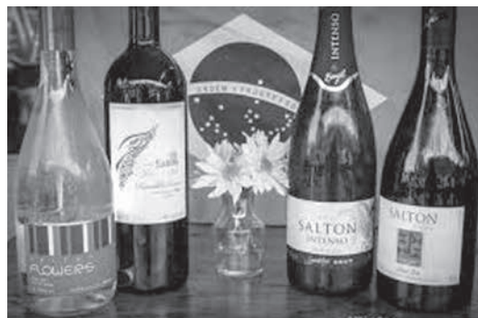
ワインとスピリッツの輸入は、2018年1〜4月の段階で、前年同期比0.8%増の2910万リットルと、すでに減速している。金額ベースでは24.1%増の1億170万ドル。前年比34.4%増を記録した2017年のように追いついていないという。他方、為替相場のこうした動きは輸出には追い風だ。1〜4月のワイナリーとスピリッツの輸出は、数量ベースでは前年同期比70.8%増の84万4800リットルを記録。金額ベースでは同57.7%増の210万ドルを記録した。ブラジルワイナリー協会(IBRAVIN)は、今後も為替相場が輸出を後押しすると期待しているという。

ブラジルのワインのイメージは、1〜4月に為替相場は5.23%のレアル安。しかも、このところはレアル安がさらに加速してあり、これまでの時点で年明け以降12.07%のレアル安となる。ブラジル食品飲料輸出事業者協会(ABBA)は、今後数ヶ月は輸入物のワインとスピリッツの輸入にこの為替変動が影響すると見ている。「レアル安は消費者心理に影響する。為替相場が不安定な状況になると消費者は買い控えるか、より低価格な製品を嗜好する」とい