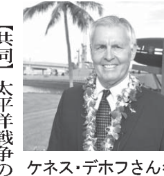
ケネス・デホフさん

【共同】太平洋戦争の戦端を開く旧日本軍の攻撃があった米ハワイ州真珠湾で2007年から昨年まで太平洋航空博物館