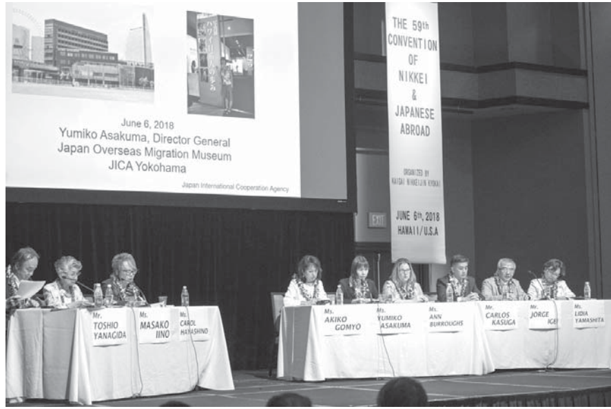
パネルディスカッションの様子

【私たち、第59回海外日系人大会(2018年6月6日開催)に世界各地からハワイに集った日系人...】