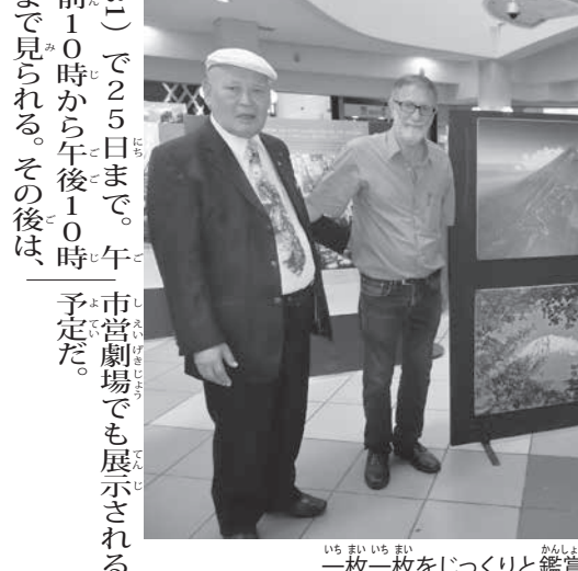
約500枚が売れた。前日からキャベツやネギを切った仕込み、当日

「世界」の日系レガシーを未来の礎に、というテーマで、6項目からなる決議を宣言した。