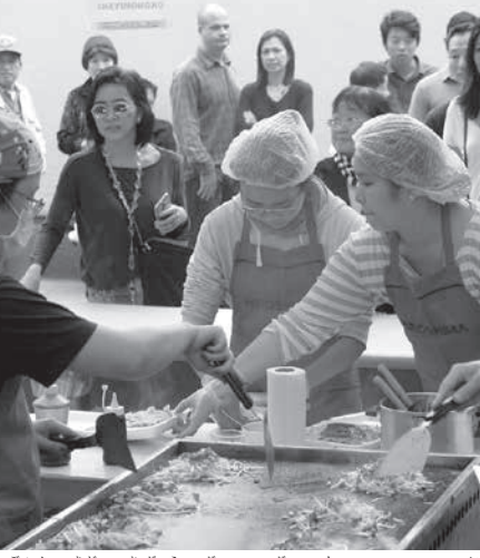
青年部員が流れ作業で次から次に作ったが、30人以上の列が出来た

「世界」の日系レガシーを未来の礎に、というテーマで、6項目からなる決議を宣言した。