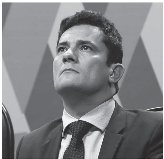
モロ判事

「LJ作戦に関する捜査において得られた情報」として得られた情報と「LJ作戦に関する捜査」として得られた情報とを区別し、前者は検察庁が管理し、後者は連邦検察庁と連邦警察が管理する。情報管理の自由な使用を禁じられた機関は、TCU、ラン・プレミアダ(企業)や「レニエンシア(企業)」「レニエンシア(企業)」「レニエンシア(企業)」など。国庫庁(CGU)、経済