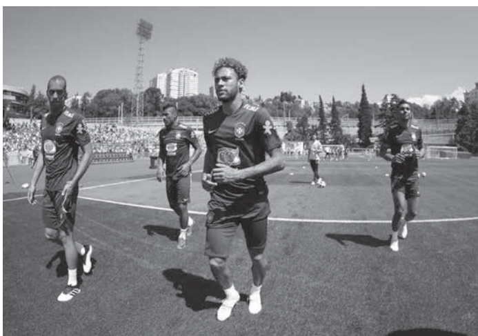
ネイマールら、10日のオーストリア戦先発組は、ロシア最初の練習は軽い調整にとどめた。

11日未明にロシアのソチ入りしたサッカーのブラジル代表(セレン)が、12日にロシアで初の練習を行った。