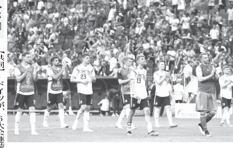
メキシコに敗れ、さえない表情のドイツレブン＝モスクワ

【共同】サッカーワールドカップ(ロシア大会)第4日(17日)モスクワほか1次リーグF組で2連覇を目指すドイツが、6大会連続1強のメキシコとの初戦に0-1で敗れた。前回覇者が黒星スタートとなるのは2014年大会のスペインに続いて2大会連続。前半、逆襲から奪われた1点を取り返せなかった。 前半35分だった。メキシコは自陣でボールを奪うと、すぐに縦へ展開した。エルナンデスが味方とのパス交換で中央を突破すると、左にラストパス。これをベナテイエリアで受けたのが、快足を飛ばして駆け上がったロシアだ。22歳のアタッカーはワンタックでエジルをかわし、右足を振り抜いた。ドイツの名GKノイアーを破って先制点をゴール左隅に突き刺した。「人生で最高のゴールだ」と喜びを爆発させた。 後半35分だった。メキシコは自陣でボールを奪うと、すぐに縦へ展開した。エルナンデスが味方とのパス交換で中央を突破すると、左にラストパス。これをベナテイエリアで受けたのが、快足を飛ばして駆け上がったロシアだ。22歳のアタッカーはワンタックでエジルをかわし、右足を振り抜いた。ドイツの名GKノイアーを破って先制点をゴール左隅に突き刺した。「人生で最高のゴールだ」と喜びを爆発させた。