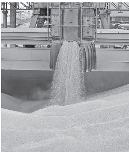
パラナグア港での大豆の積み込み

米国のトランプ政権が「王冠の宝石を守るため」と擁護品を中心とした中国製品818品目に25%（総額500億ドル相当）の輸入関税を課す事だ。米国のシリコンバレーのハイテク技術を指しながら、米国の自国の技術や産