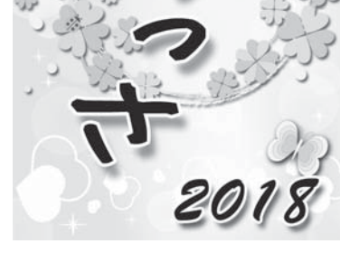
習字の練習