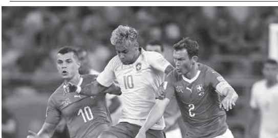
ドリブル突破を試みるネイマールと、激しくマークするスイスディフェンス

伯国出身で、スペイン人の43%（約7千人）は、聖州とリオ州パラナ州の総人口に相当する。