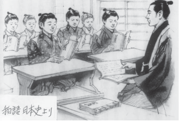
幕末の寺子屋の風景