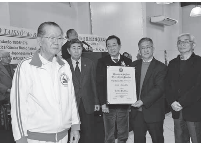
名誉市民の称号を受ける木下会長(左)