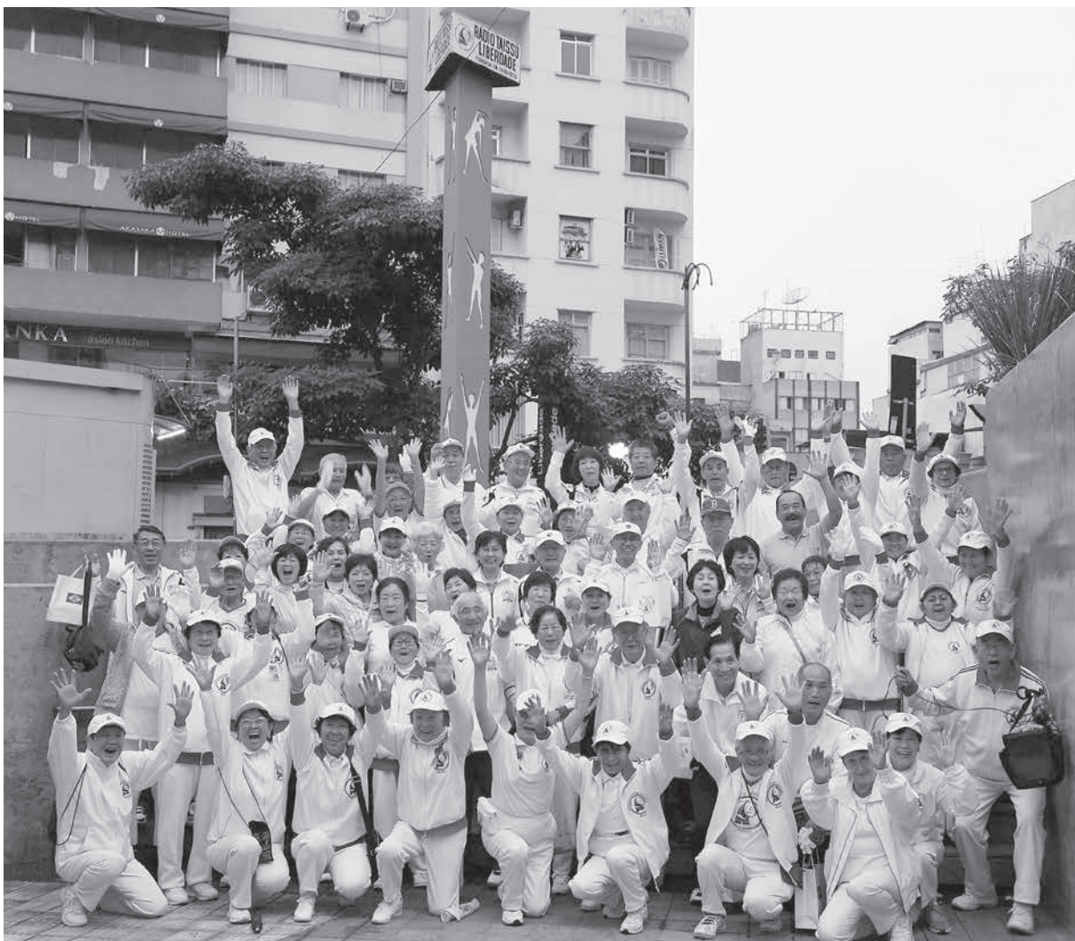
16日朝6時、リベルターデ体操記念塔の前で、同体操会の皆さんと顔合わせをして元気に記念撮影