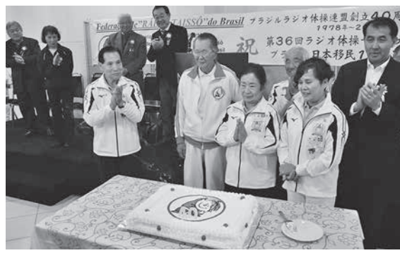
「40周年ケーキ」をカットして祝った

「創立40周年晩餐会」は午後7時から「レイリスホテル」で行われた。全国ラジオ体操連盟90周年、日本移民110周年も併せて祝し華やかな雰囲気の中執り行われた。