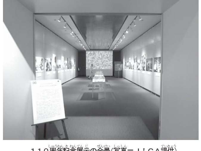
110周年記念展示の全景

このことに感謝する意味を込めて開催されたのが1957年5月国際連合加盟記念海外日系人親睦大会、既に第1回海外日系人大会でありました。そして、2011年3月11日、未曾有の大震災となった東日本大震災、この時もまた、多くの国からの支援はもちろんだが、日系社会の皆様からも金銭、物品等の支援は続いています。