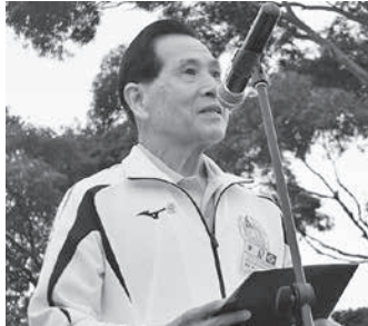
挨拶する長野副理事長