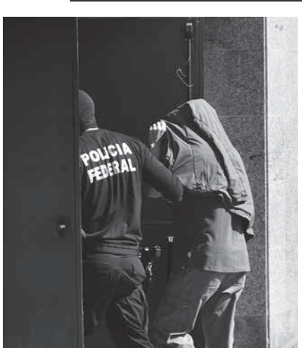
連警に連行される容疑者