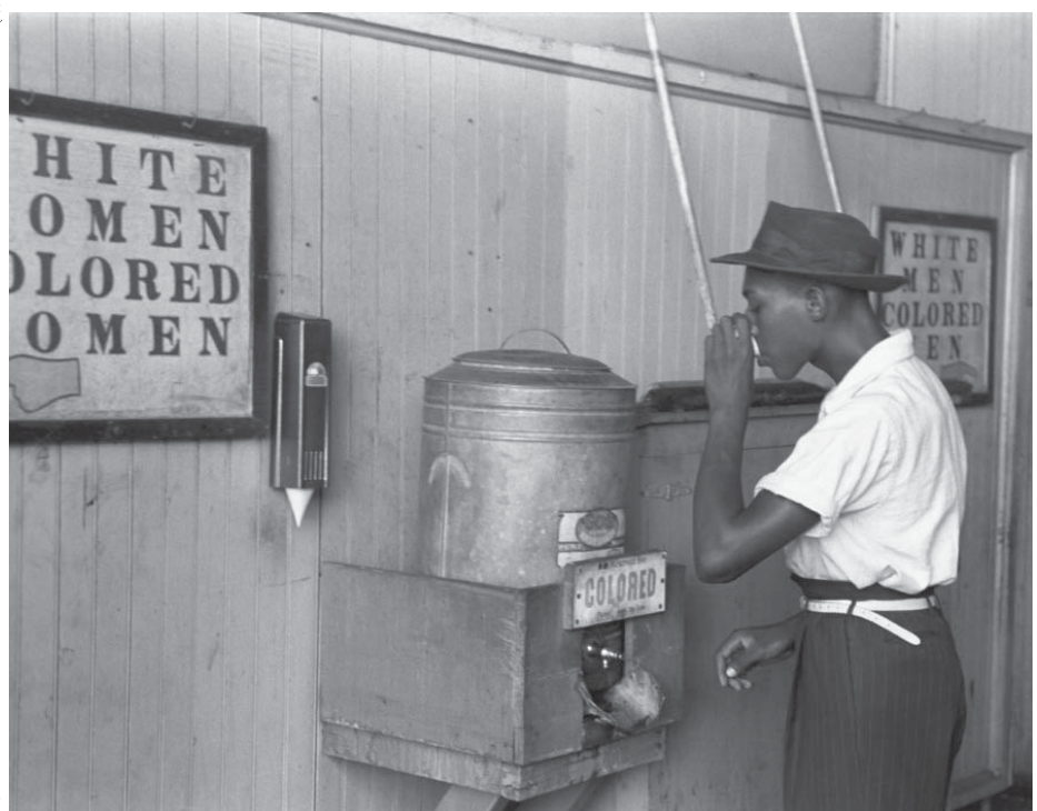
1939年の米国では、水道が白人と有色人種で分かれていた。

さらに、サンパウロのIPEA (Instituto de Pesquisas Econ. e Sociais)、応用経済研究所や、「ソウ・ダ・パズ」研究所(Sou da Paz Institute)による暴力の調査を紹介し、黒人の2・4倍も多く殺害されていることが報告されている